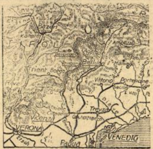
Das Etsch- & Brenntal

— Mäuse als Vorkämpfer. Unlänglich der Medizin auf einem schlesischen Staatsbahnhof fiel es auf, daß sich einige Mäuse an zwei großen im Güterboden lagernden Kisten zu schaffen machten. Die Kisten waren einige Tage zuvor aufgegeben und ihr Inhalt als Bücher bezeichnet worden. Die Mäuse rochen jedoch den Graten, denn bei der in dienstlichem Auftrag erfolgten Öffnung beider Kisten fand man, statt des deklarierten Inhaltes, etwa zwei Zentner Schwein- und andere Fleischwaren. Vielleicht empfiehlt es sich jetzt, auf allen Güterböden Polizeimäuse einzustellen.