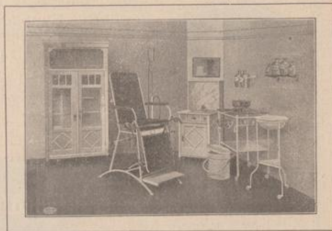
Ärztliches Sprechzimmer Modell „Special“ Mk. 268.—

Vorteilhafteste Preise! • Günstigste Zahlungsbedingungen! • Hunderte Anerkennungen!