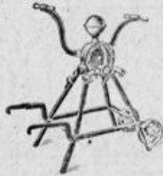
Handpumpe „Aetna“, D. R. P.

Lager in Berlin, Paris, Buenos-Aires, Melbourne und New-York.