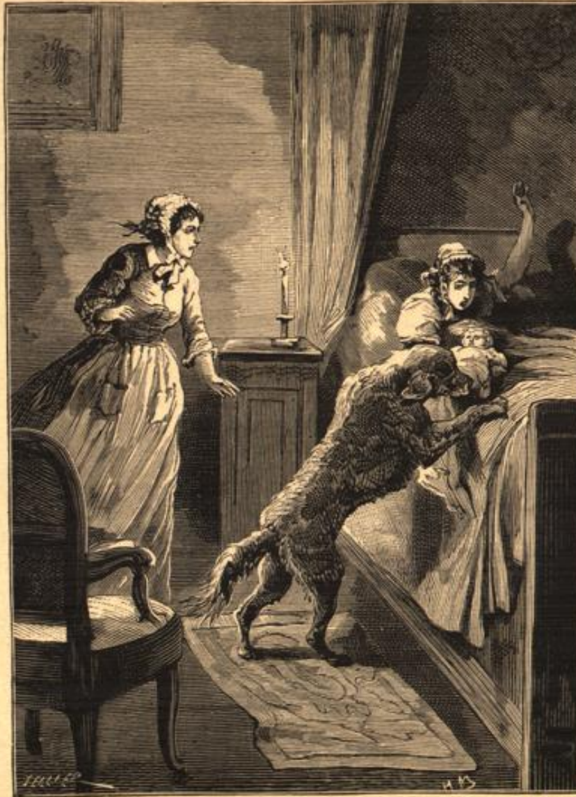
Fluchbeladen. Der Hund schnappte nach dem Kind. (S. 211.)

— „Ja, nicht wahr, ich flöhe Dir Abscheu ein!“ sagte er mit erstickter Stimme. „Es ist begreiflich. Sie haben mich ja nie geliebt, Sie hassen mich, und ich habe Ihnen den Geliebten getödtet!!!“