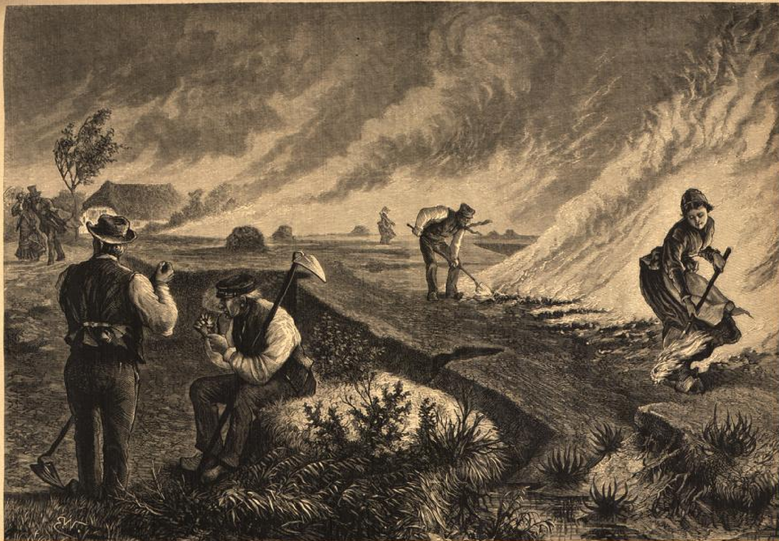
Teil Meerbrennen in Ostfriesland. Aus: „Bilder für Schule und Haus“. (Verlag von J. J. Weber in Leipzig.) (S. 211.)