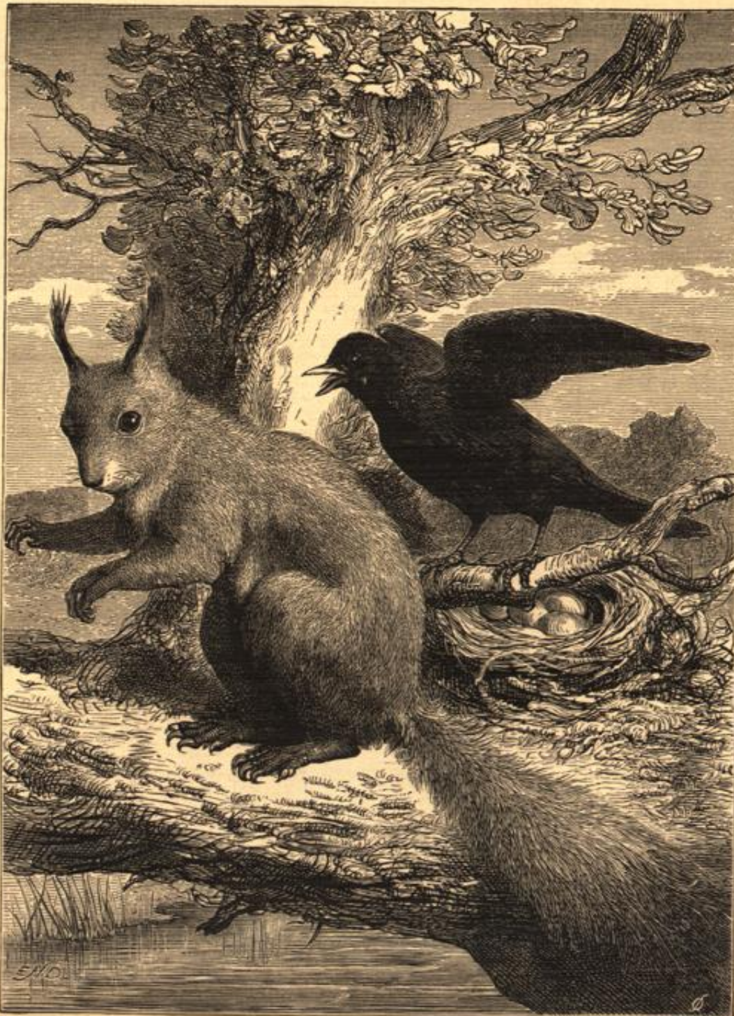
Auf der That ertappt.

„Wie stellen Sie sich das vor?“ fragte gespannt Herr Blomkist.