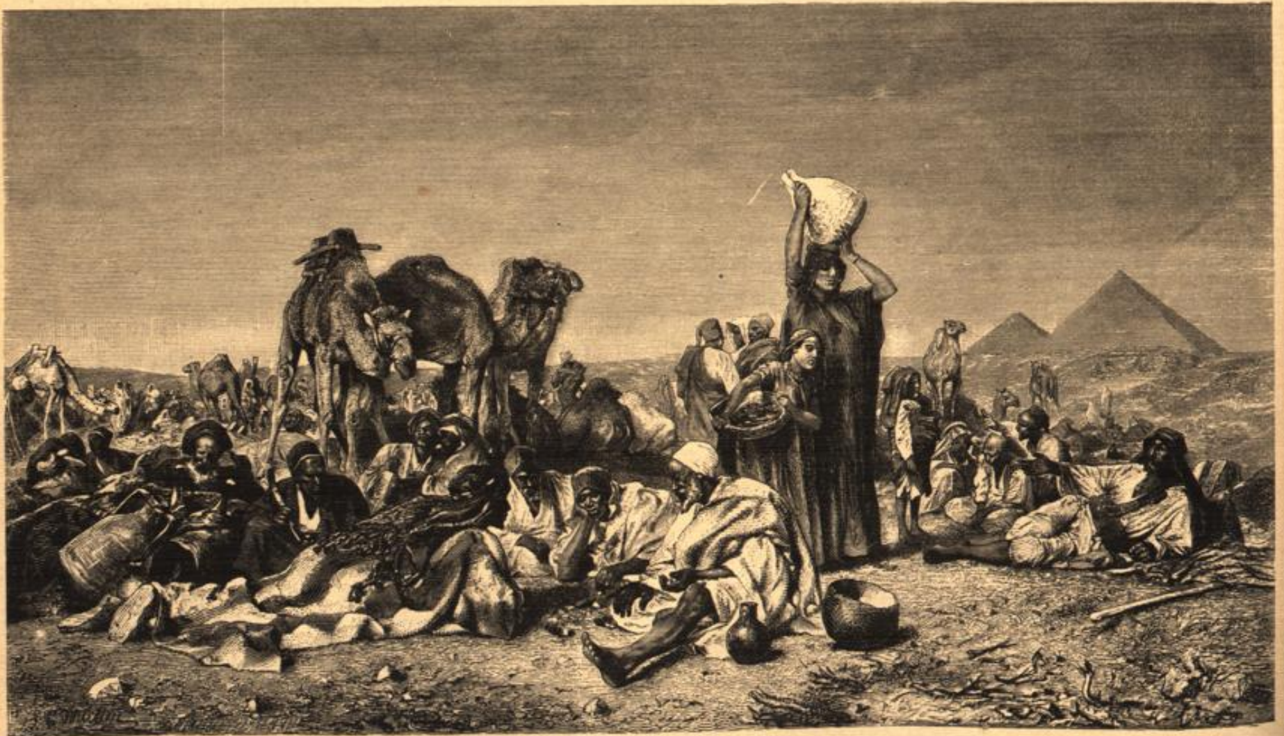
Beduinenlager. Originalzeichnung von Leopold Carl Müller. (S. 207.)

Die Gräfin fuhr fort: „Ich bekam einen Sohn. Ich durfte hoffen, daß das kleine Wesen uns einander nähern würde. Aber es war nicht so. Seit Sie das Kind hatten, übersehen Sie mich fast ganz, als hätte ich nun meine Aufgabe erfüllt und sei unnütz geworden. Sie entzogen mir dieses Kind. Sie wurden eifersüchtig auf dasselbe, und Sie quälten mich dadurch grausamer als je zuvor. So haben Sie mich in allen meinen Gefühlen gedemüthigt, verkleinert und gekränkt. Es bedurfte eines Schlags wie der heutige war, um mir all' mein Selbstgefühl, all' meinen Stolz wiederzugeben. Ich bin wieder ich selber geworden. Es ist das erste Mal, daß Sie in mein Herz sehen, Graf, und das