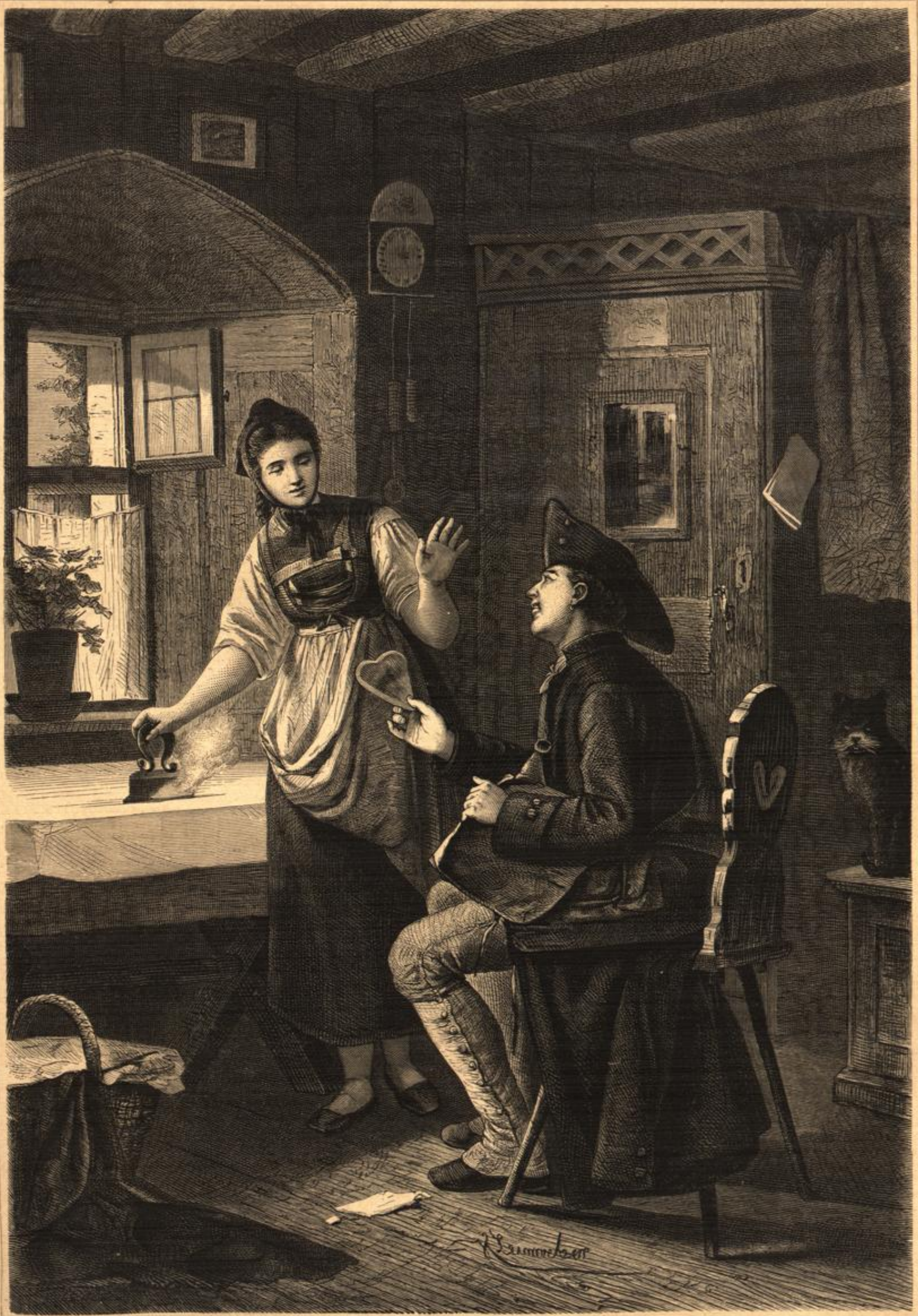
Dein ist mein Herz! Gemälde von H. Leinweber. (S. 238.)