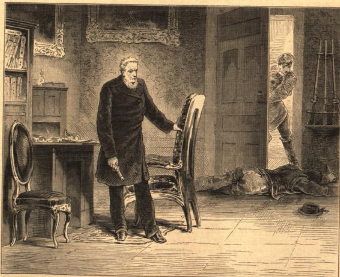
Die „Donna Anna“. Des Kapitans Liebling. (S. 230.)