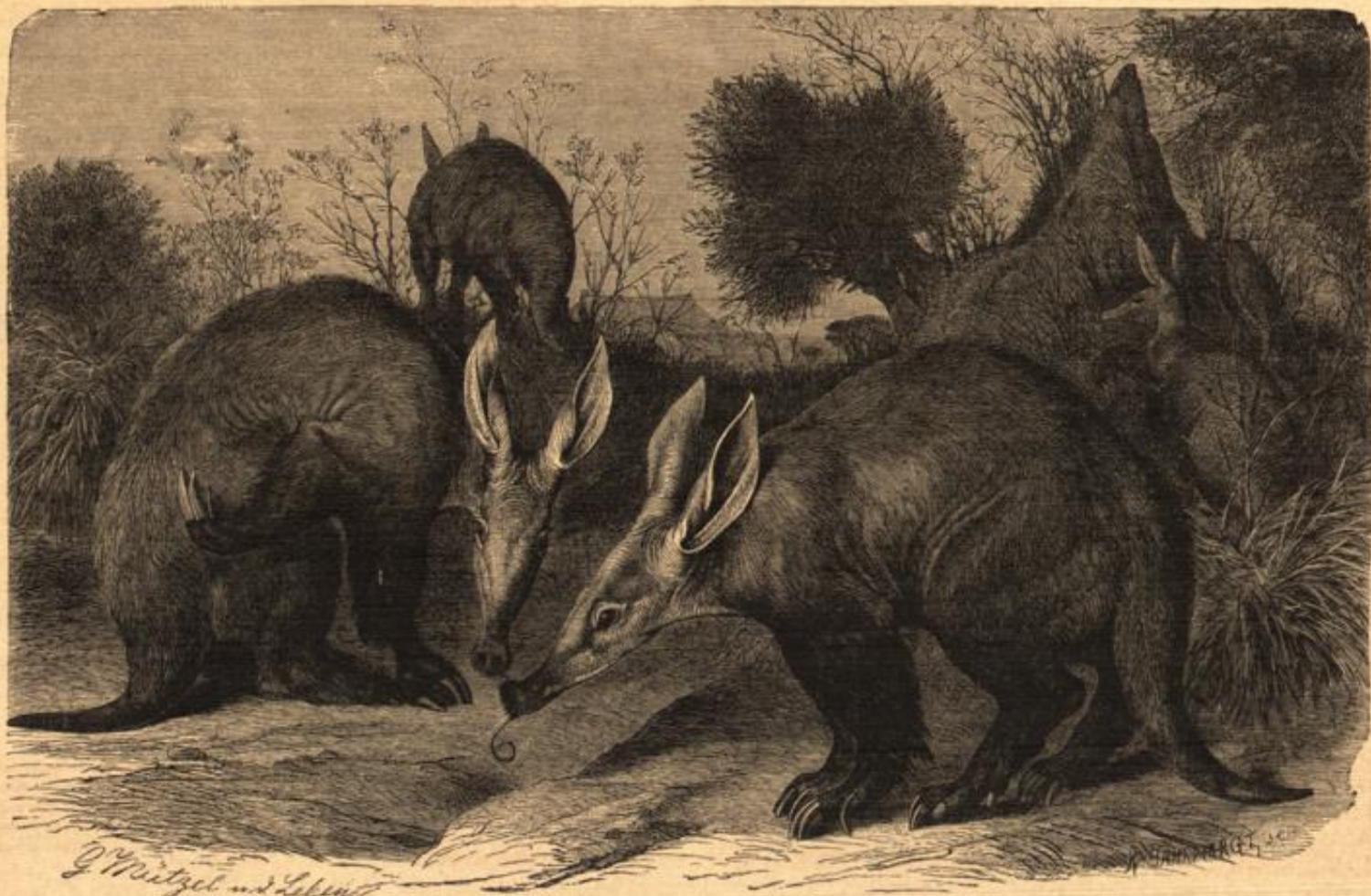
Das Erdferkel. Zeichnung von G. Kühel. (S. 238.)

Mit den Römern aber war Einer gekommen, der wußte in der Gegend merkwürdig Bescheid. Man erzählte sich im Gau, er sei heimisch da und sei vor langer, langer Zeit hinausgezogen und dann verschollen. Doch Niemand wußte das gewiß, denn er war ein alter Mann.