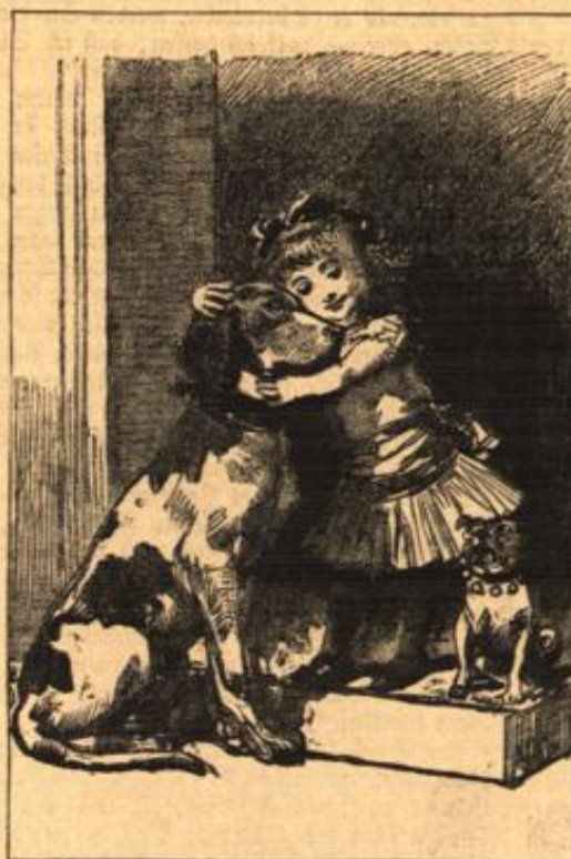
„Dich hab' ich gern!“