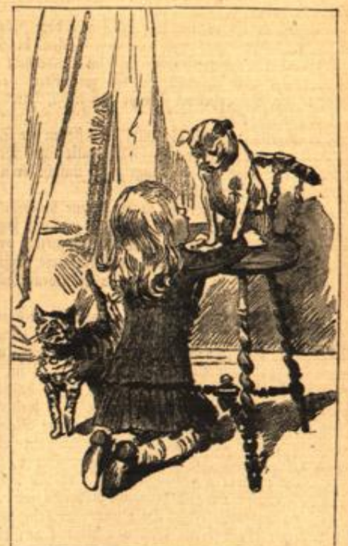
Die alte und die neue Liebe.

Unsere Kleinen. Zeichnungen von Adrien Marie.