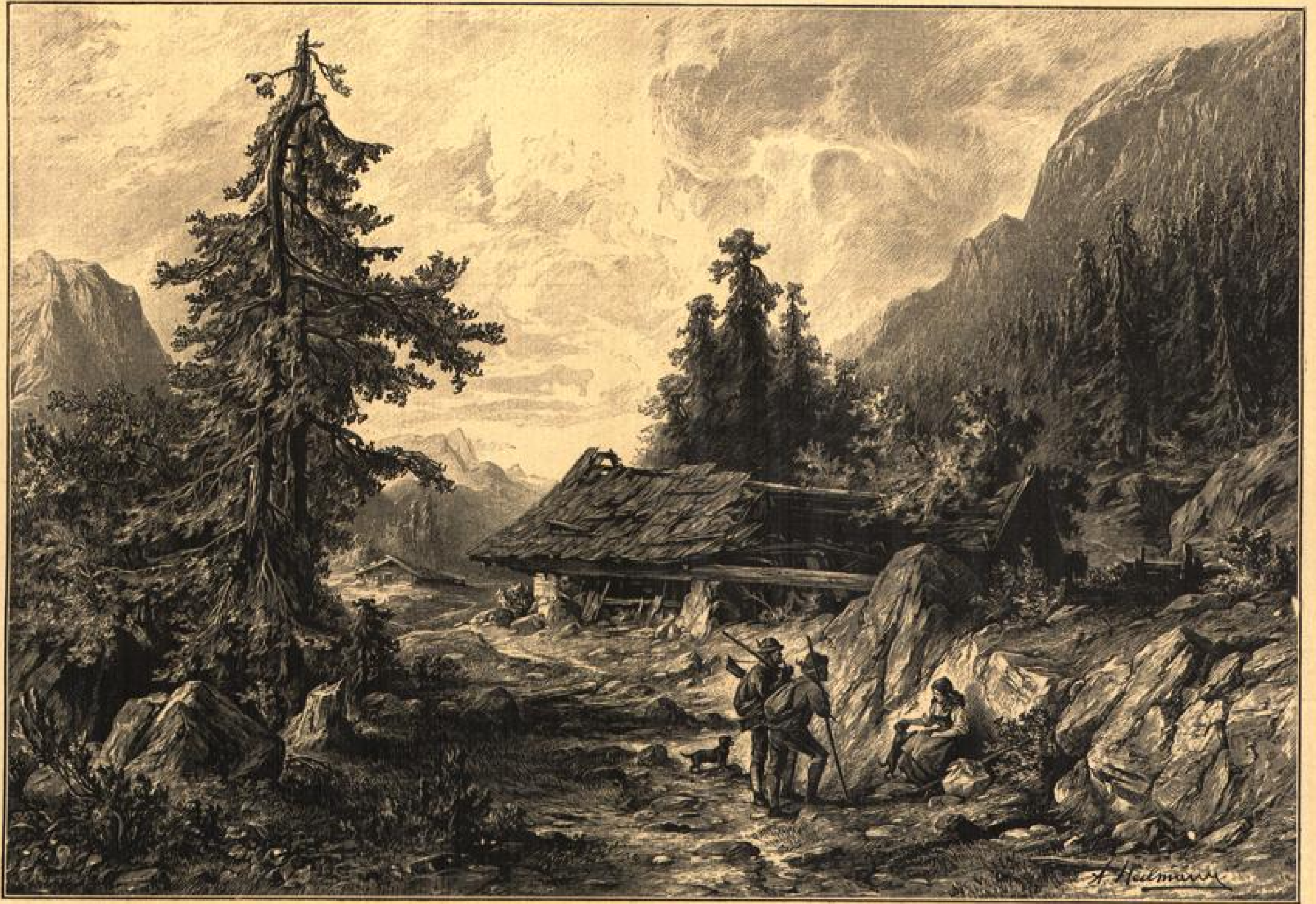
Berlätene Wimbütte. Originalzeichnung von N. Gölmann. (E. 500.)