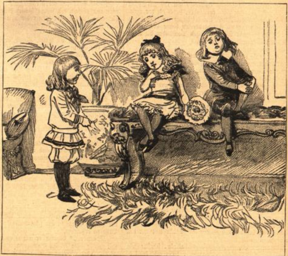
„Ich will mitspielen!“