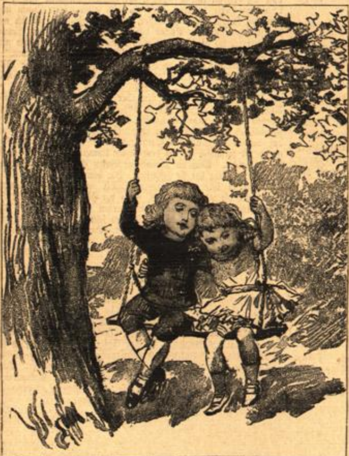
„Wir wollen hier oben bleiben!“