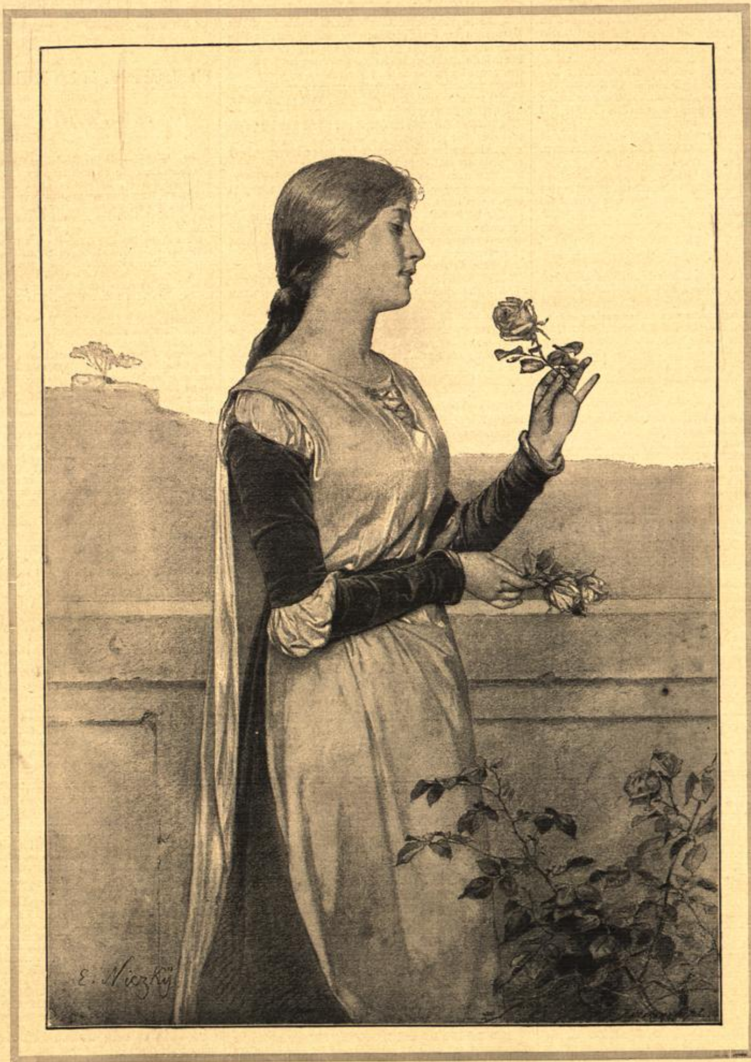
Florentinerin. Von Eduard Nizky. (S. 543.)

furt a. O. gesehen, als er vor dem Referendaregamen stand, und nun in diesem Aufzuge! Ich unterstützte ihn, so gut ich konnte, viel hatte ich selbst nicht. Nach einigen Jahren suchte er mich wieder auf und nun war ich zu meiner Freude in der Lage, ihm kräftiger unter die Arme zu greifen. Im Verein mit mehreren