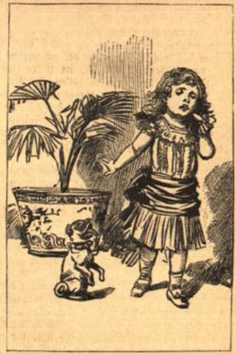
„Nein! Ich habe selbst zu wenig.“