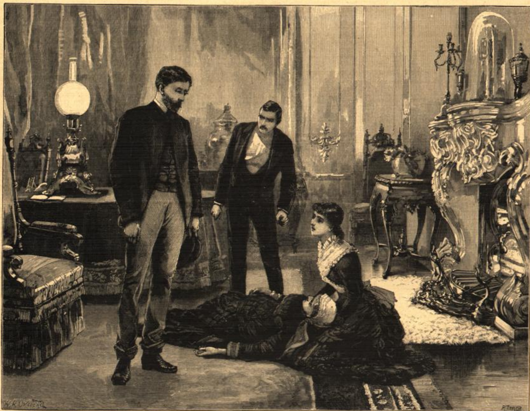
Die Mine von St. Gurlott. „Wollen Sie jetzt nicht gehen? Bitte!“ sagte Madeline leise. „Um ihre ermillen.“ (S. 542.)

„Das Geschäft betrifft Sie, Mr. Redruth,“ entgegnete