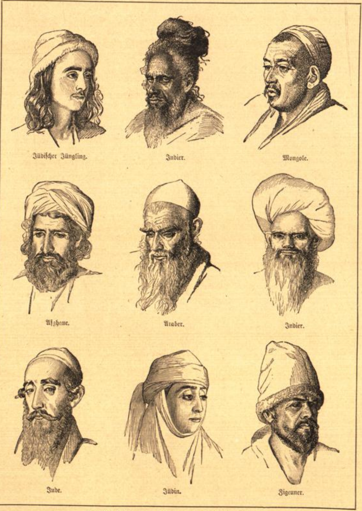
Asiatische Volkstypen. Skizze von V. Bertschagin. (S. 82.)

„Ihr Herr Schwiegervater wird sicherlich auf Ihre Rückkehr dringen,“ sagte er. „Oder besitzt er außer Ihnen noch Söhne?“ „Er befaß nur ein Kind, meine Gattin.“ „So werden Sie später die Plantage übernehmen?“ „Voraussichtlich — ja,“ nickte der Baron, „ich sehne mich so sehr nicht darnach, obgleich die Rente, die dieses Kapital abwirft, sehr hoch genannt werden darf.“ „In der Regel kehren die Herren in ihre alte Heimat zurück, wenn sie drüben Schätze gesammelt haben.“ „Nicht immer, Herr Hauptmann; ich kenne drüben viele Deutsche, die an ihre alte Heimat nicht mehr denken.“ „Weil sie drüben an die Scholle gebunden sind!“ „Nein, weil das Leben drüben ihnen besser behagt.“