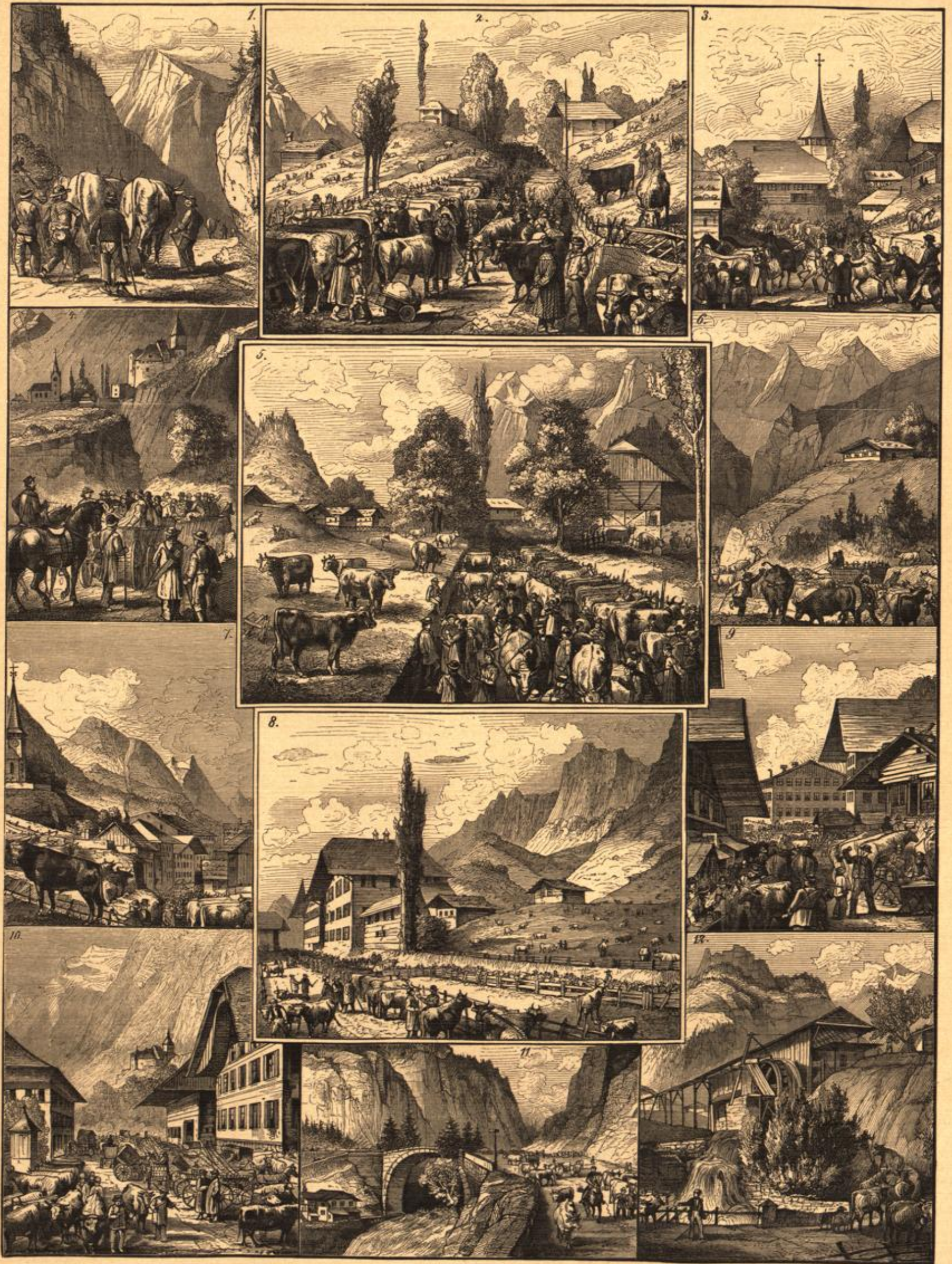
1. Viehtreiber. — 2. Mittelerlenbach, gegen Bad Weisnburg. — 3. Eingang in's Dorf, Pferdemarkt. — 4. Zum Markt. — 5. Mittelerlenbach, gegen Thun. — 6. Untermegs nach Erlenbach. — 7. Dorf Erlenbach. — 8. Obererlenbach. — 9. Seiler- und Glodenhändler. — 10. Bei Rothhüsti. — 11. Eingang in das Simmenthal. — 12. Wassermühle.

Viehmarkt im Simmenthal. Originalzeichnung von Karl Jauslin. (S. 79.)