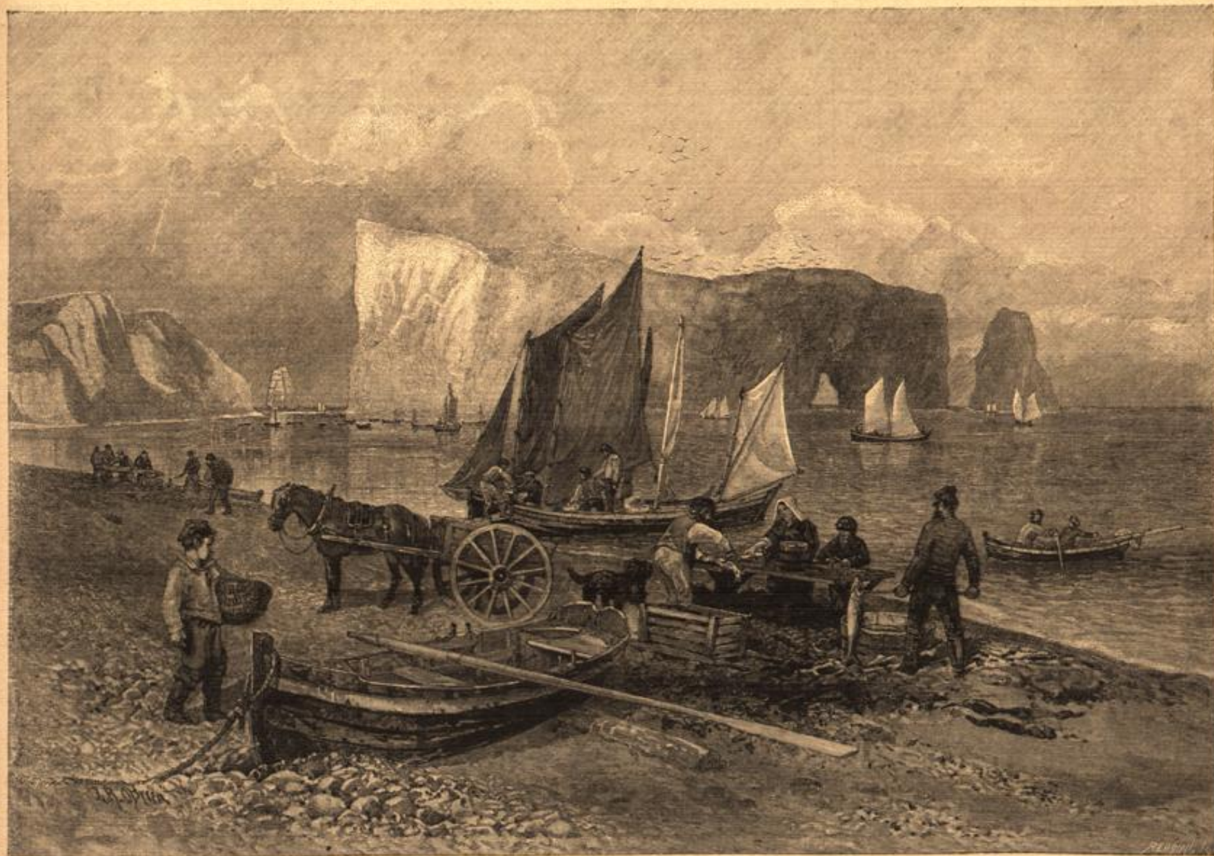
Am Strande von Percé (Kanada). Zeichnung von L. R. O'Brien. (S. 79.)

Das waren die Erwägungen und Entschlüsse des Herrn Liberio Berruggas, die ihn so eilig nach Hamburg und in