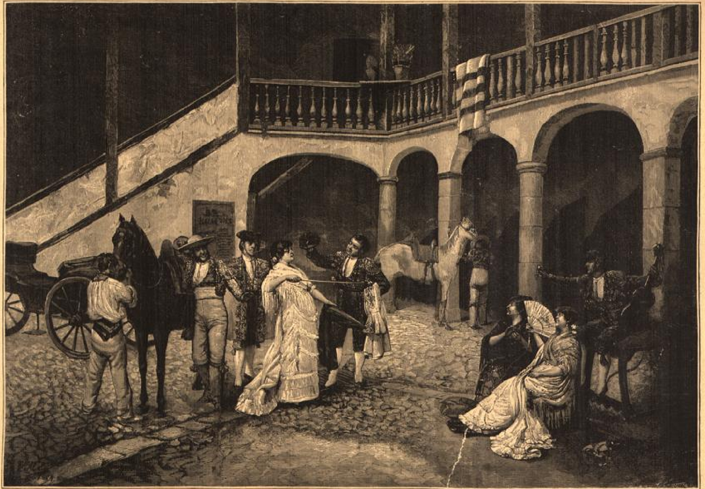
„Erlitten bei dem Stierkampf.“ Gemälde von Jof. Maxson. (S. 82.)