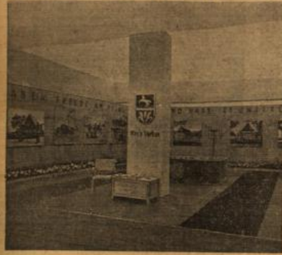
So stellen die Kreise aus.

Gestern sind die ersten 20 Waggons mit Material für den Aufbau der Ausstellung „Wille und Tat“, die vom Institut für Deutsche Kultur- und Wirtschaftspromaganda unter Mitwirkung der Gesellschaft Hallen-Kaufhaus sowie wirtschaftlicher und kommunaler Verbände in der Zeit vom 25. August bis 10. September in Wiesbaden veranstaltet wird, am Bahnhof eingetroffen. Heute oder morgen wird mit den Arbeiten begonnen werden. Ein gewaltiges Pro-