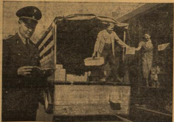
Wahnerstand von frischem Obst auf schnellstem Wege.

Die Aufgaben, die der Deutschen Reichsbahn im Dienste an der Allgemeinheit gestellt sind, sind mannigfaltig. Für den Eisen tritt der Personen- und Güterverkehr in den Vordergrund der Betrachtung. Aber es gibt da noch eine ganze Reihe von Sonderaufgaben, die zu erfüllen die ganze Einsatzbereitschaft der Organisation und jedes einzelnen der Beschäftigten erfordert. Tag und Nacht rollen die Gütertransporte kreuz und quer durch das Großdeutsche Reich. Sie sorgen für den Transport der Rohstoffe und Lebensmittel, befördern Fertigprodukte vom Erzeuger zum Verbraucher. Und gerade in der Zeit der Ernte werden allgrößte Anforderungen an den Reichsbahnbetrieb gestellt. Was der Bauer und Gärtner in mühseliger Arbeit auf seinem Grund und Boden erwirtschaftet, muß reiflos dem Verbraucher zugute kommen, kein Nahrungsmittel darf verloren gehen. Und so ist denn auch der Gedanke „Kampf dem Verderb“ mit bestimmend gewesen für den Einfluß der Reichsbahn beispielsweise bei der Obf- und Obstbeförderung. Wir wissen ja, daß das meiste Obst, vor allem die Obstfrüchte, so schnell wie möglich dem Verbraucher zugeführt werden müssen, um größere Ausfälle zu vermeiden. Es spielt ja auch auf den Märkten eine große Rolle, in welchem äußeren Zustand das Obst zum Verkauf gestellt wird. Ist es unansehnlich, wird sich der Käufer nicht so leicht entschließen, dem Händler die Ware abzunehmen.