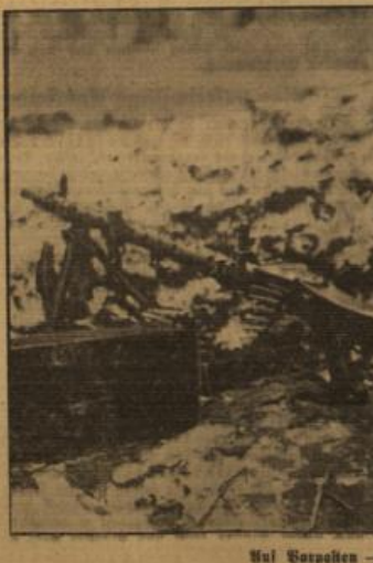
Mit Vorkathen — dem Feind am nächsten Der MG-Volke im verhöhlen Grenzwall achtet auf jede Bewegung im Niemandsland (SR-Bauer-Weltbild — 8.)

Manchester-Schiffhafen durch die Trümmer unpassierbar London, 26. Jan. Am Freitagabend ereignete sich, wie weiter meldet, in dem Elektrizitätswerk in Manchester eine schwere Explosion, die einen schweren Brand zur Folge hatte. Die ganze Stadt des ziemlich großen Hafens, das am Ufer des Manchester-Schiffhafens liegt, ist in die Luft, und die Trümmer türmen in dem Kanal, der dadurch unpassierbar wurde. Das Werk versetzt ein großes Stückwerk und den gesamten Bezirk mit Strom.