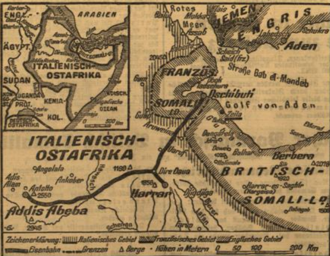
Italiens Erfolge in Britisch-Somaliland

22 jüdische Journalisten kamen ins Konzentrationslager Bukarest, 9. Aug. 22 meist jüdische stellungsgelose Journalisten, die sich mit der Verbreitung von gegen die Interessen des Staates gerichteten Gerüchten beschäftigten, wurden verhaftet und in ein Konzentrationslager gebracht. Unter ihnen befindet sich auch der feinerische Direktor des großen, vor einigen Jahren schon eingestellten jüdischen Blattes „Adeverul“, Socor.