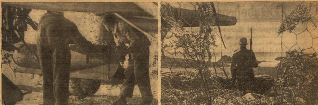
Links: Von einem deutschen Feldflughafen in Frankreich. Verladen eines schweren Brodens. — Rechts: Deutsche Wacht an der französischen Küste. Schwere deutsche Geschütze schützen die Hoheisenfahr.