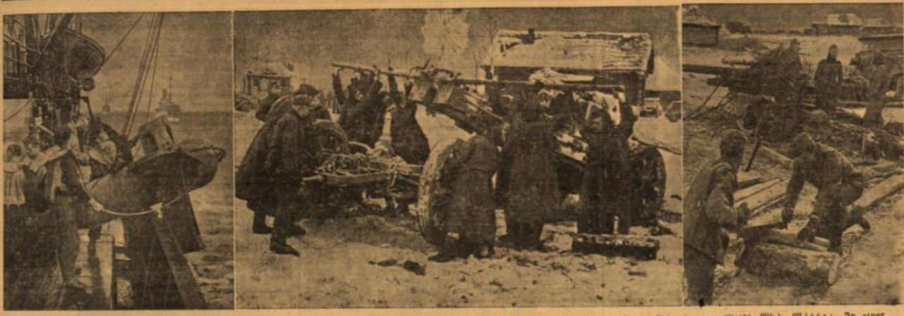
Links: am Schneepfluge. Im Vordergrund, der Nebel, machen unsere Winterkinder die Luft zu das Schmelzer für (V.a. Aufnahme: Kriegsbericht Zepf, W.B.). Mitte: In einer deutschen Winterkinder der Wostan. Das feindliche Widerstand ist nicht ergriffen. Die Geschäfte werden aufgezogen. (V.a. Aufnahme: Kriegsbericht Zepf, W.B.). Rechts: Bei 20 Grad Kälte am Feld. In jeder Pause wird einig Brennholz geheizt, an dem es zum Glück nicht mangelt. (V.a. Aufnahme: Kriegsbericht Zepf, W.B.)