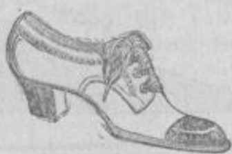
Schwarz und braun.

durch bequemes Schuhwerk zweifellos gefördert. Zwei hier abgebildete Schuharten haben sich infolge ihrer unübertroffenen Annehmlichkeit die Gunst des Publikums im Sturm erobert. Wir bieten in jeder Beziehung gerade hierin ganz hervorragendes. Ein Vergleich unserer Preise wird dies Kennern bestätigen.