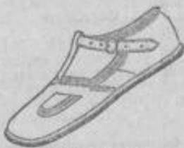
Vom Kleinsten bis zum Größten.