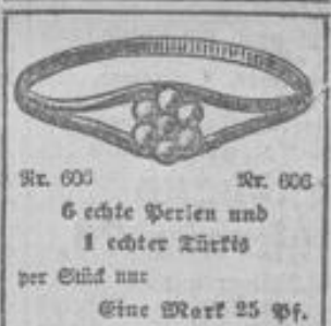
Nr. 600 Nr. 600 6 echte Perlen und 1 echter Türkis per Stück nur Eine Mark 25 Pf.