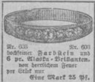
Nr. 603 Nr. 601 hochsein. Farbstein und 6 pr. Maske-Brillanten, von herrlichem Feuer per Stück nur Eine Mark 25 Pf.