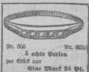
Nr. 606 Nr. 605 5 echte Perlen per Stück nur Eine Mark 25 Pf.