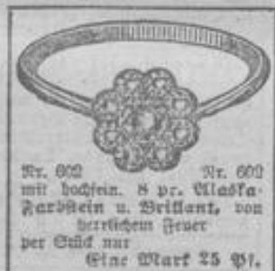
Nr. 602 Nr. 600 mit hochsein. 8 pr. Maske- herstein u. Brillant, von herrlichem Feuer per Stück nur Eine Mark 25 Pf.