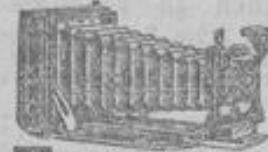
Photo-Apparate neuester Modelle renommiertester erster Fabriken mit Objektiven von Voigtländer, Goerz, Meyer, Rodenstock, Plaubel u. a.

Als billiges Glas, gallicischer Konstruktion, empfehlen wir speziell für Sport und Reisen das sehr lichtstarke, elegant ausgestattete Armee-Fernglas Mk. 36.50 neuestes Modell, mit ca. 1/2 mal Vergrößerung inkl. festem Leder- Etui mit Riemen zum Umhängen gegen Monatszahlungen. Verlangen Sie per Postkarte Auswahlendung 6 Tage z. Ansicht ohne Kaufzwang. Ferner gegen erleichterte Zahlungen