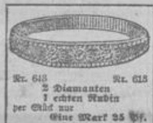
Nr. 618 Nr. 615 2 Diamanten 1 echter Rubin per Stück nur Eine Mark 25 Pf.

Achtung! Ein sensationelles Angebot. Achtung!