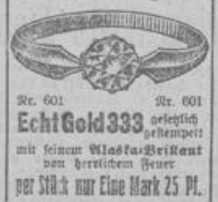
Nr. 601 Nr. 601 Echt Gold 333 gelehrt mit feinem Maske-Brillant von herrlichem Feuer per Stück nur Eine Mark 25 Pf.