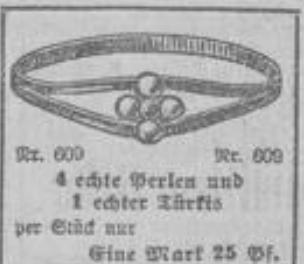
Nr. 600 Nr. 600 4 echte Perlen und 1 echter Türkis per Stück nur Eine Mark 25 Pf.

Meine Lykosia-Gold-Ringe, die sich in ganz kurzer Zeit die Gunst des Publikums erworben haben, sind nach einem besondern Verfahren aus beech Gold plattiert. Hunderte Nachbestellungen sind der beste Beweis für die Schönheit der Ringe.