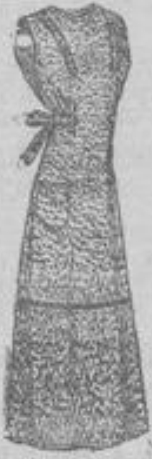
Kleiderschürze, Prinzessform, aus gutem Siamosen, tadelloser Sitz, wie Abbildung . . . 1 95