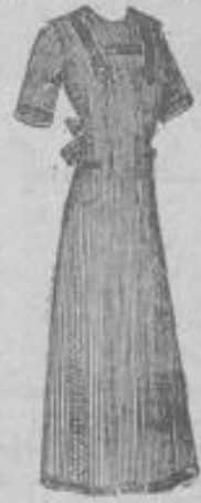
Kleiderschürze mit 1/2 langem Arm, flotte Garnitur, tadel- loser Sitz, wie Abbildung . . . 2 45

Joseph Wolf, 62 Kirchgasse 62 gegenüber dem Mauritiusplatz