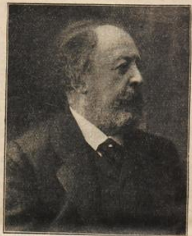
Paul Heyse †. (S. 72)