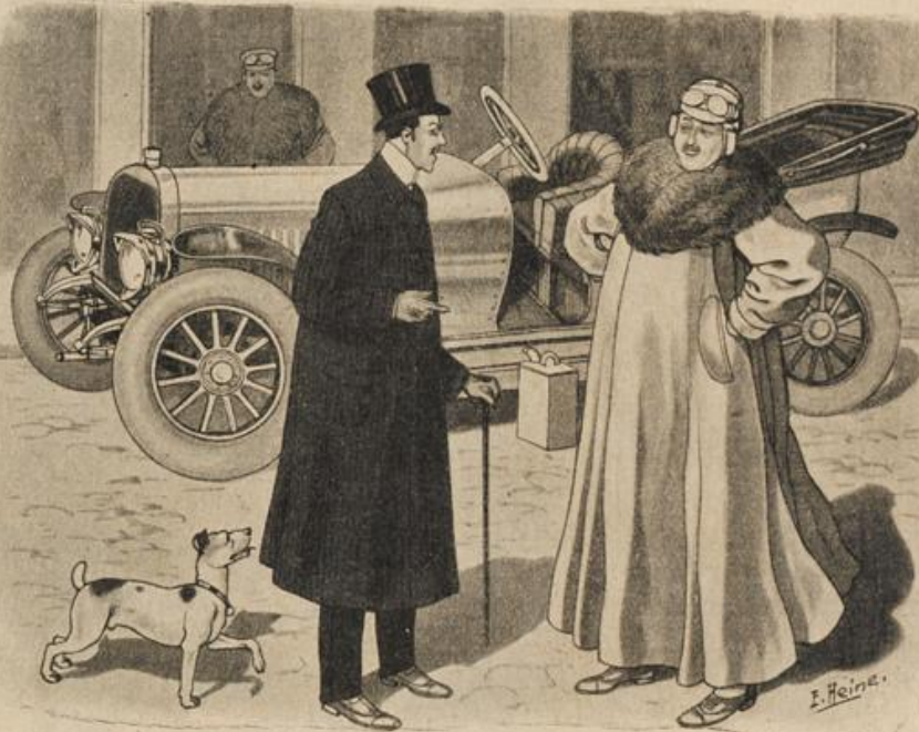
Bodo: Na, Bodo — was sagst du nun? — Neues fünfzigpferdiges Auto — feinste Ausstattung — eleganten Sportdress und flotten Chauffeur — jetzt fehlt mir nur noch 'n nettes kleines Weibchen — Bodo: Die das alles bezahlt!