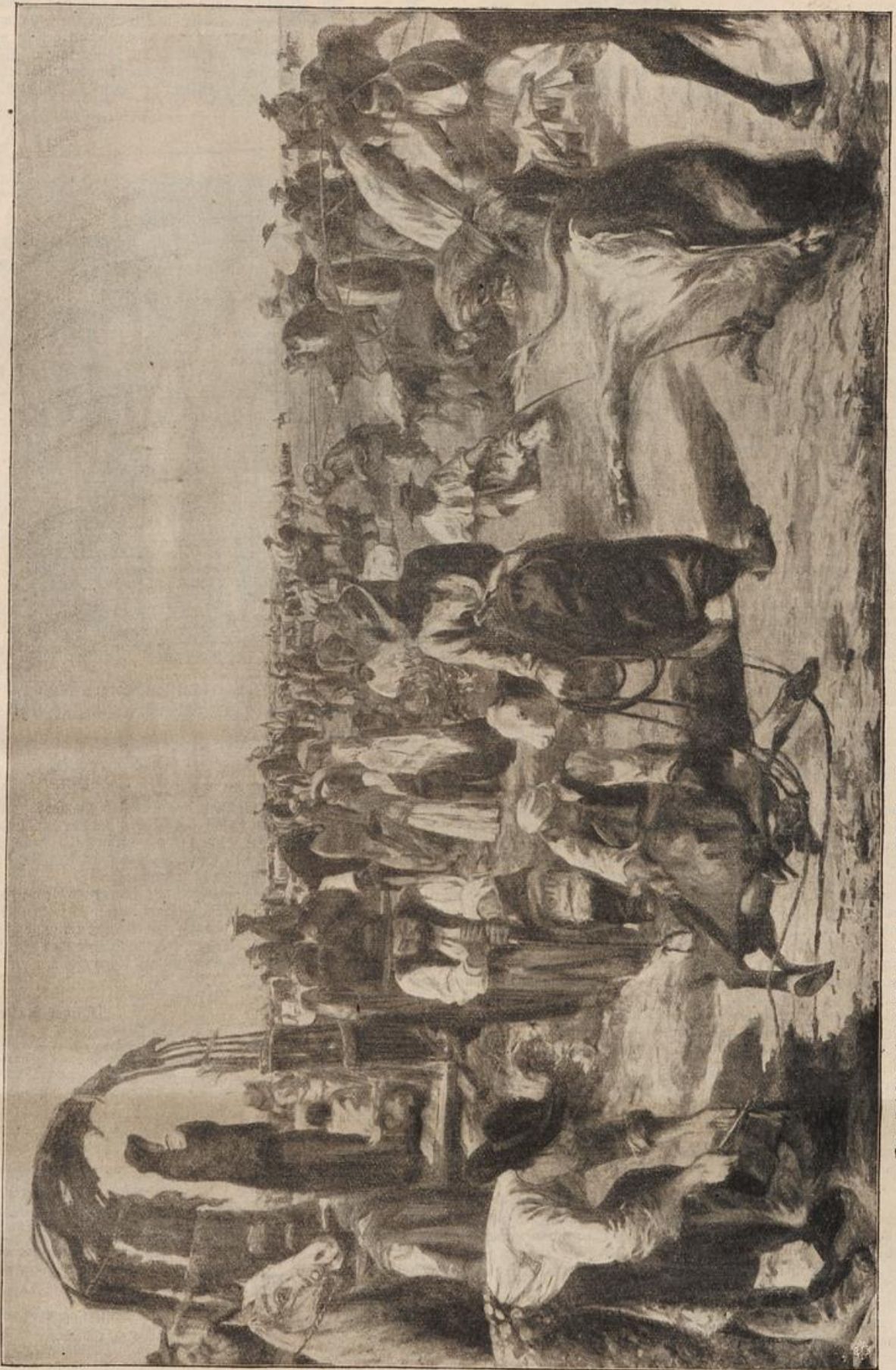
Das Zeichen der Kinder in den argentinischen Pampas. Nach einem Gemälde von Maria D. de Soto y Caspo. (S. 72)

„Wofür ich aber danke,“ fiel die Baronesse lebhaft ein. „Ich hab' dich ja schon zwei Tage nicht gesehen.“