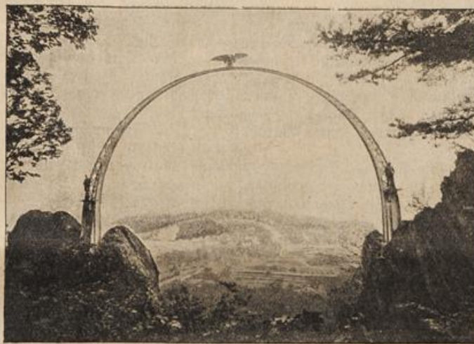
Der Wolkefelsen auf dem Donnersberg (Rheinpfalz). (S. 72)

hellen Überrock — und hier: Die Tür war ein bißchen offen und es war Licht in der Küche — und hier: Es war gegen halb sieben, ich habe gerade Feuer gemacht in meiner Küche — Sehen Sie, der helle Überrock überhebt mich jedes Gedankens, der Ihrem Verlobten zu nahe treten könnte. Der Mann mit diesem Überrock war der letzte Besucher Ihrer Tante. Das ist auch durch die Aussage des Bäckergehilfen Meißl erwiesen, der in der Einfahrt Ihres Hauses schon vor sieben Uhr auf seinen Schatz wartete. Es freut mich selbst, daß ich Sie jetzt vollständig beruhigen kann, und daß Herr Otto Falk unbelästigt bleiben wird. Er hat mir nämlich, obgleich ihn sichtlich etwas bedrückt, sehr gut gefallen, Ihr Verlobter. Es ist Ihnen beiden zu gratulieren.“