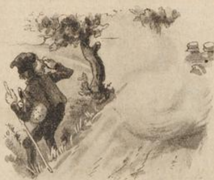
Die weil die Auto auf den Straßen Ihn ärgern über alle Maßen.