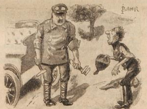
„Entschuld'gen S'“, sagt das Bäuerlein, „Kann ich vielleicht behilflich sein?“