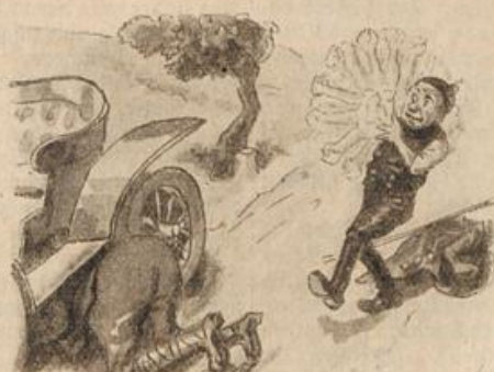
Damit der Hieb ihm gut gelingt, Den Arm er in der Achsel schwingt,