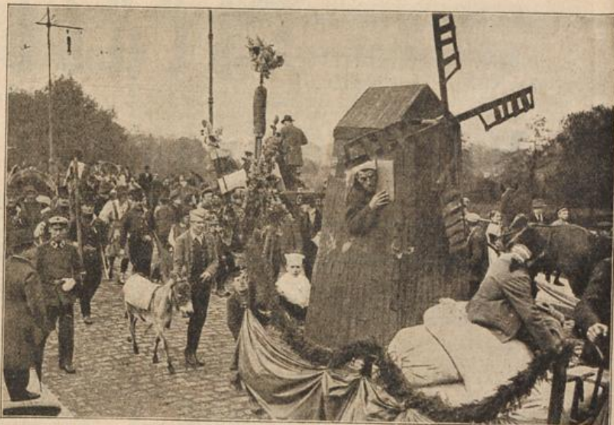
Gruppe aus dem Festzug zum 300jährigen Jubiläum der Bäckereimung in Köpenick. (S. 96)

Die Kranke hatte ihn mit Augen angesehen, aus denen ebenso sehr Angst wie Zweifel schauten, dann wurde sie wieder bewusstlos.