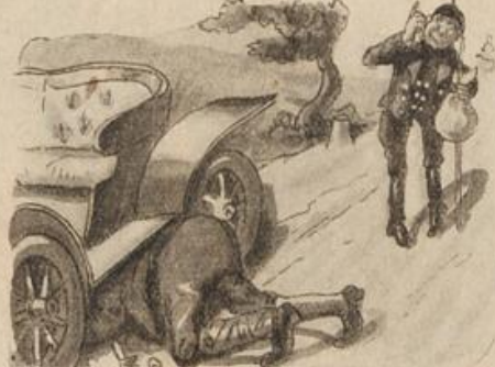
Und siehe da! — nach kurzer Zeit Gibt es dazu Gelegenheit.