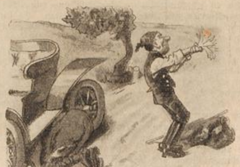
Auch die Geschmeidigkeit der Hand Prüft man durch Schlenkern, wie bekannt,