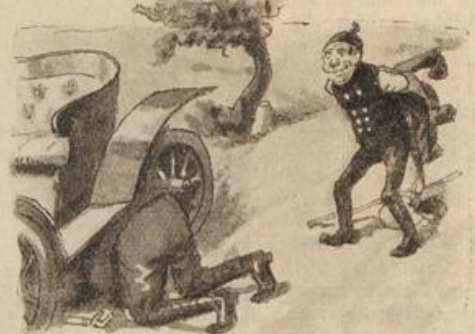
Damit er nicht behindert werde, Legt seinen Rock er auf die Erde,