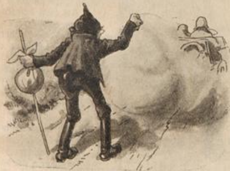
Wenn einen Autler er erwischt, Daß er ihn mörderlich verdrischt!