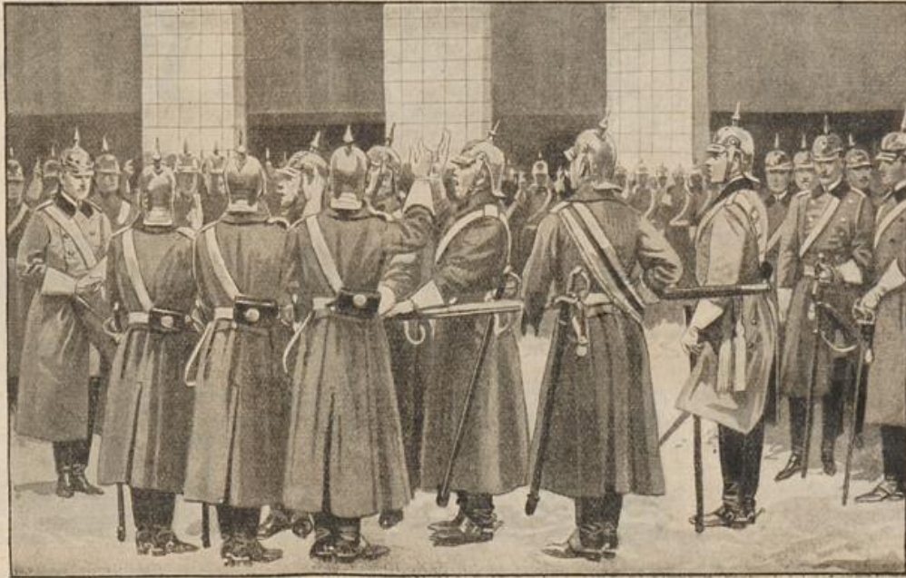
Vereidigung der Rekruten bei der Kavallerie.

Die Vereidigung der Rekruten bei der Kavallerie. (Mit Bild.) — Die Rekrutenzeit ist eine harte Afs, die aber, mögen auch manchem Mutterhöhnchen dabei die Augen übergehen, schließlich doch gefnackt wird. Die genaueste Zeiteinteilung, Ordnung, Sauberkeit und strenge Pflichterfüllung einzuhalten, ist nicht jeder von Haus aus gewöhnt, und es ihm beizubringen, ist für den Rekrutenoffizier und die Unteroffiziere keine leichte Aufgabe. Fühlt sich der Rekrut einigermaßen in seiner „Aluft“ wohl, und ist er über die Anfangsgründe des militärischen Stehens und Gehens hinaus, dann kommt der feierliche Tag der Vereidigung, bei der der Kavallerist den Treuschwur auf die Standarte seines Regiments leistet.