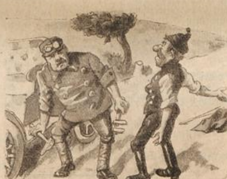
In diesem Augenblick gerade Erhebt das Opfer sich — wie schade!