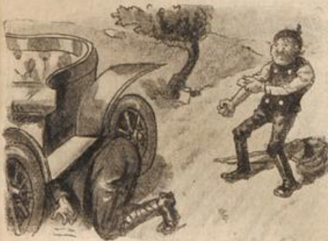
Dann krepelt er die Armele auf: Jetzt, Rache, gehe deinen Lauf!