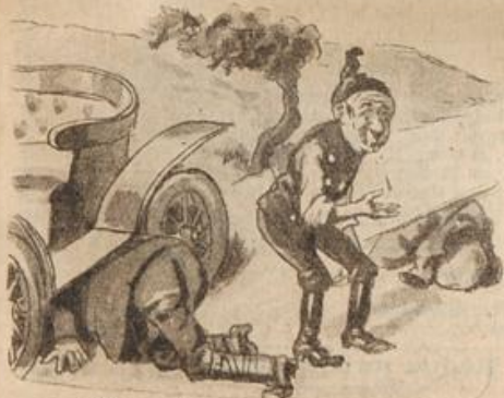
Dann wird sie angefeuchtet gut, Damit es tüchtig knallen tut.