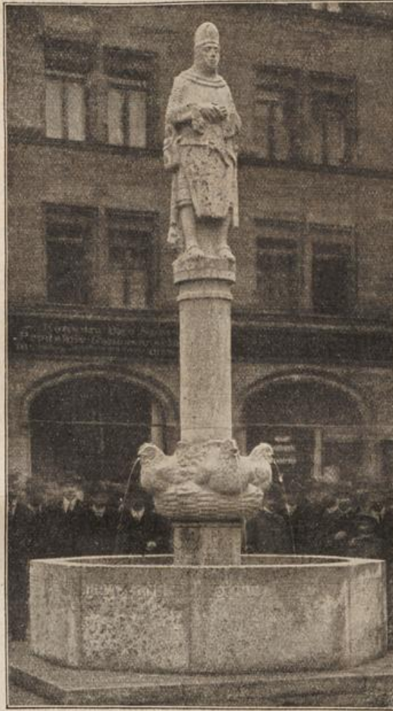
Der neue Schweppermannbrunnen in Nürnberg. (S. 96)