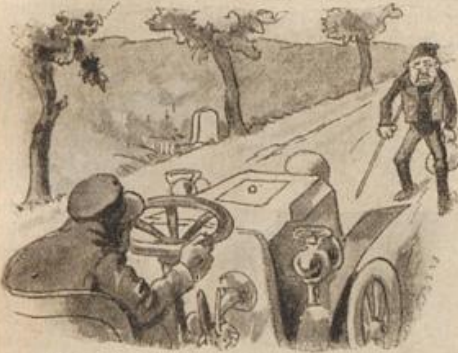
Der Bauer Veit mit zorn'gem Sinn zieht schimpfend seines Wegs dahin,