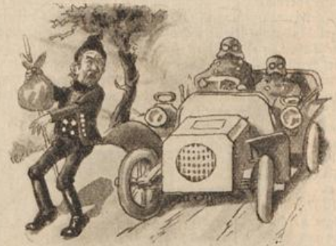
Schon wieder eines! Und der Veit Schwört einen fürchterlichen Eid: