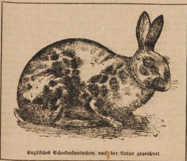
Englisches Scheckkaninchen, nach der Natur gezeichnet.

Gescheckte Kaninchen hat es schon immer gegeben, aber man betrachtete diese bunten Gesellen als Zufallsprodukte, die in den meisten Fällen nicht beliebt waren und sogar als Beweise der Inzucht dienten. Heute ist ja vieles anders geworden, und auch auf dem Gebiete der Kaninchenzucht haben sich Wandlungen vollzogen, die erstaunlich sind. Die Scheckzeichnung ist konstant geworden, und es gibt in dieser Hinsicht schon mehrere Sonderrassen, die sich von einander deutlich unterscheiden. Dem farbenfreudig empfindenden Tierzüchter kommen diese Schecken ja sehr gelegen, und die Sportzüchter haben vollauf zu tun, um die raffigen Merkmale dauernd und standardgemäß herauszuzüchten. Ob aber mit der Schaffung solcher Spezialrassen und namentlich unter peinlichster Bevorzugung einer genau vorgeschriebenen Zeichnung die Devise: „Kaninchenfleisch muß Volksnahrung werden“, näher rückt, ist sehr zu bezweifeln.