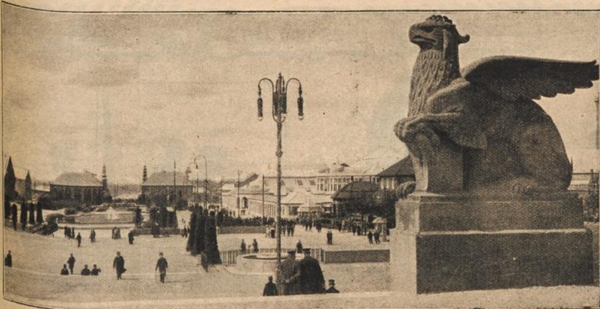
Die Bugra: Gesamtübersicht.