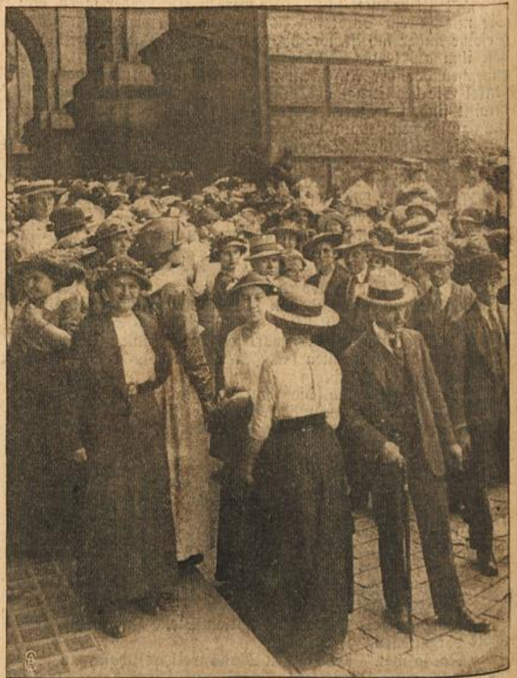
Andrang von Berlinerinnen zum Kursus für Krankenpflege vor dem Reichstagsgebäude.

Eine Zentralmelde- und Auskunftsstelle hat das Rote Kreuz im Reichstagsgebäude eröffnet. Außer mündlichen Auskünften erhalten alle sich Meldenden Fragebogen ausgehändigt, aus denen die Grundsätze der freiwilligen Krankenpflege usw. ersichtlich sind.