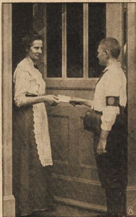
Ein Gymnasiast als Telegraphenbote.