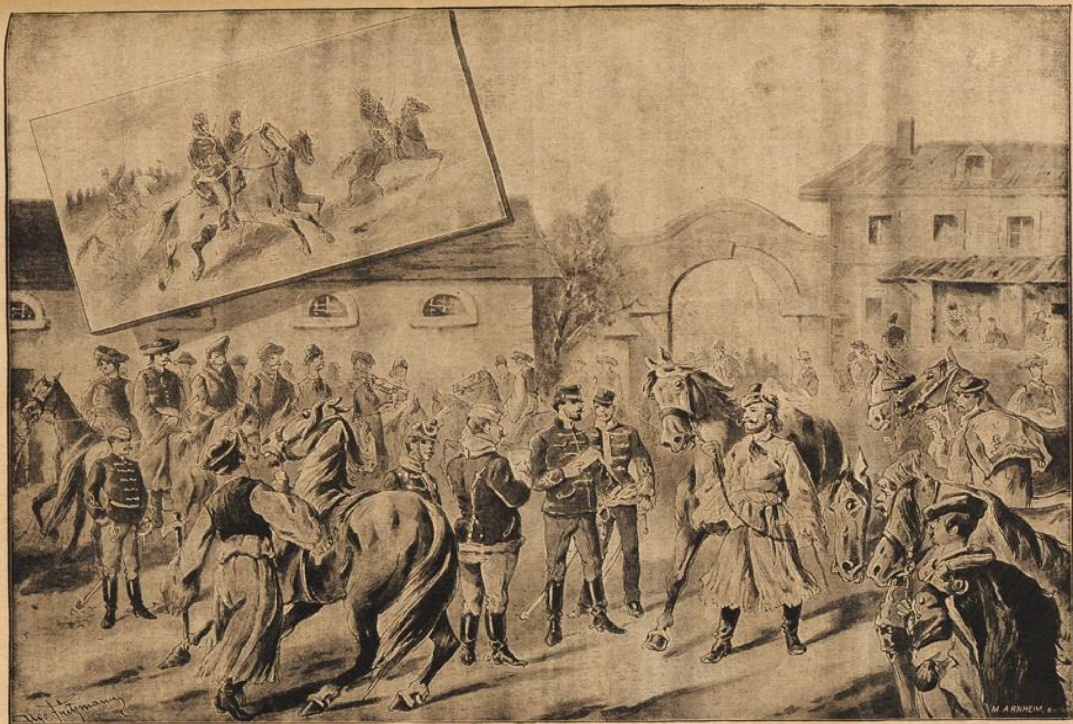
Hushebung zu den ungarischen Honved-Husaren und Attacke gegen die Russen. Nach dem Gemälde von Frizmann.