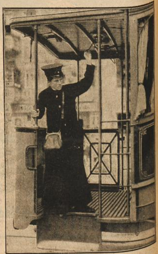
Straßenbahn-Schaffnerin als Ersatz der eingezogenen Schaffner.

„Abend für Abend mit meiner steinernen Braut und dem alten Manne zusammen Trübsal spinnen zu müssen,“ gähnte er jetzt vor sich hin, „das halte ein anderer aus. Laß sehen — der alte Woitek wird heute mit den Vorberei-