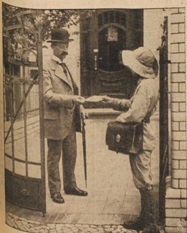
Pfadfinder im Dienste der Reichspost.

Der, dem ihre Gedanken folgten, trachte unterdes, einen neuen Gassenhauer pfeifend, auf einem sandigen Waldwege durch den Stebenhagener Forst. Mit vollen Zügen sog er die süßliche Waldluft ein. Sein Auge schweifte über die wohlgepflegten Kiefernreihen rechts und links des Weges, und er dachte an „seinem“ Malchentin gehörten. Der alte Uragroßvater Malchewis, der Stebenhagen um ein Butterbrot verkauft, schmeißt bei seinen Betrachtungen nicht gerade günstig ab.