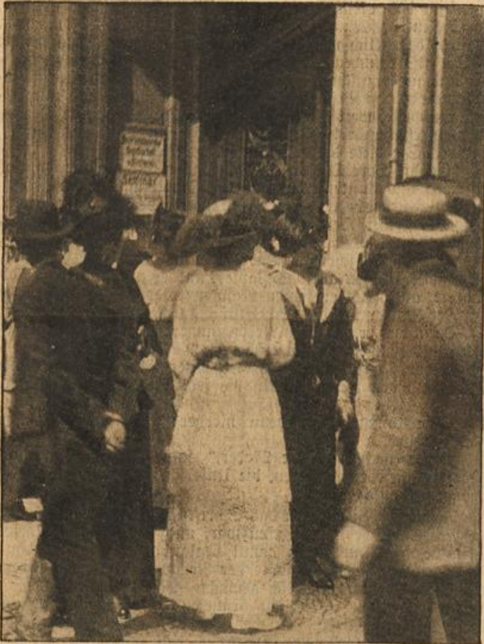
Andrang vor einer Meldestelle des Roten Kreuzes.

Eine Zentralmelde- und Auskunftsstelle hat das Rote Kreuz im Reichstagsgebäude eröffnet. Außer mündlichen Auskünften erhalten alle sich Meldenden Fragebogen ausgehändigt, aus denen die Grundsätze der freiwilligen Krankenpflege usw. ersichtlich sind.