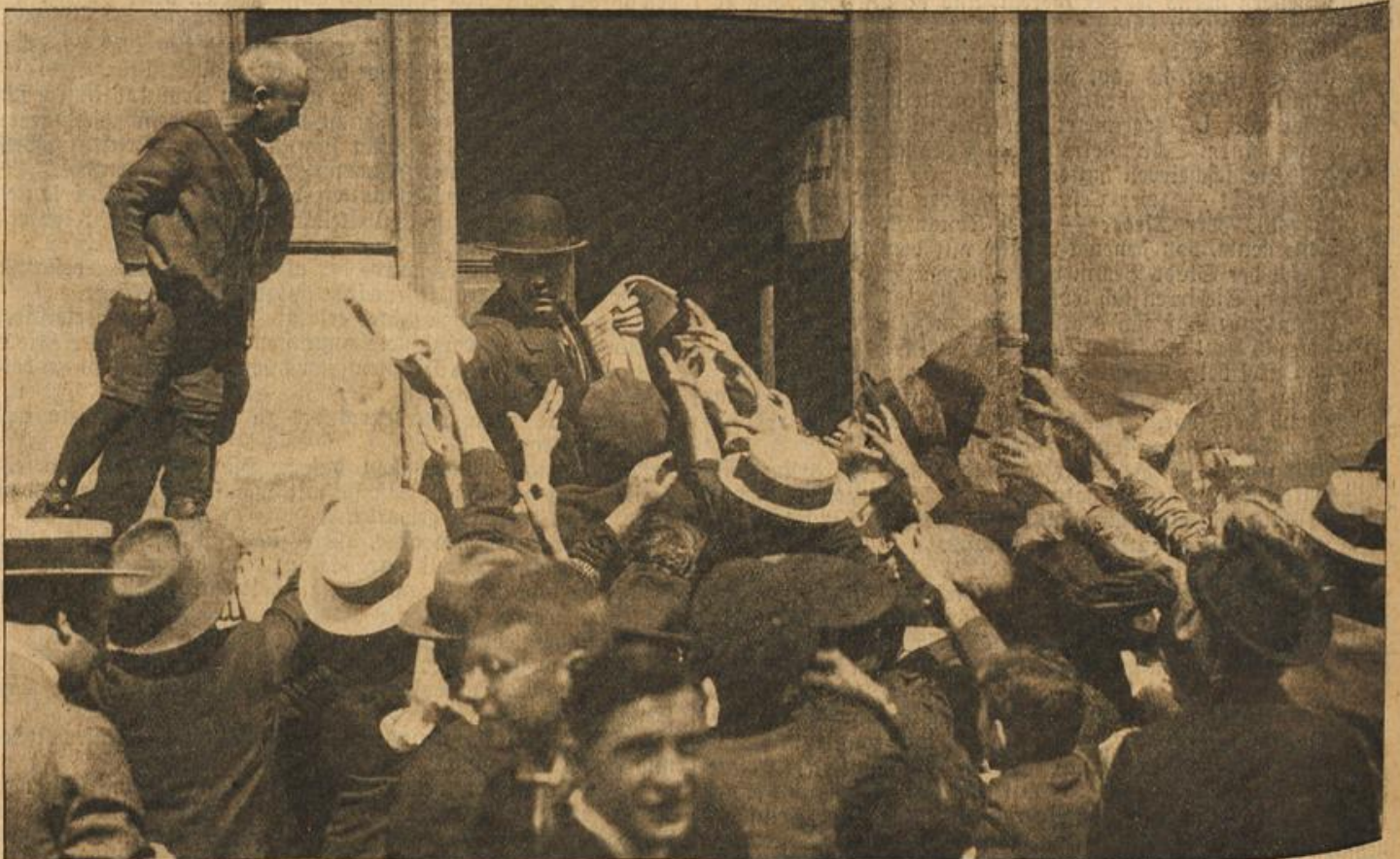
Extrablatt-Verteilung über deutsche Siegesnachrichten.

Der Verteiler muß vor dem Ansturm des Publikums in einen Haussflur flüchten. Die Nachrichten von den Kriegsschauplätzen erwecken allerorts großen Jubel. In den Straßen drängen sich die freudig erregten Massen in wildem Ansturm um die Verteiler der Extrablätter, die gleich Siegesfahnen triumphierend in der Luft geschwenkt werden. Dann strömt die Menge nach allen Seiten auseinander, um die Freudenbotschaft von den Waffenerfolgen überallhin zu verbreiten.