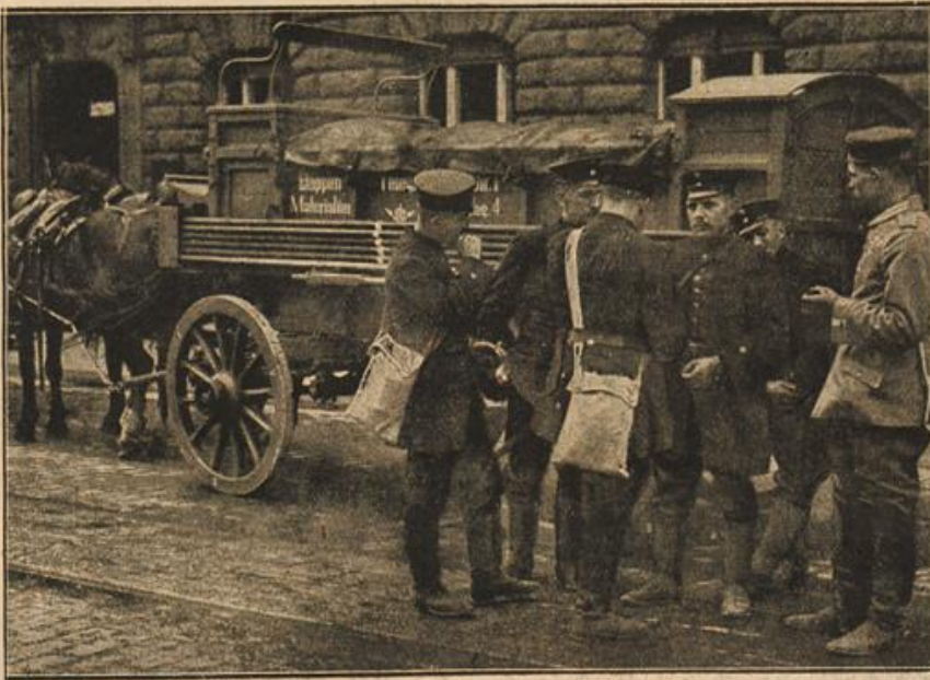
Stappenwagen der Feldpost mit Briefträgern.

als er anfangs zu hoffen gewagt hatte. Sein Freund hatte ihm, als er ihm von seiner Verlobung und seinen infolgedessen veränderten Zukunftsaussichten Mitteilung machte, in so selbstloser und so selbstverständlicher Herzlichkeit Glück gewünscht — ja, er hatte sich ihm sogar, falls er seiner irgendwie bedürfen sollte, in jeder Weise zur Verfügung gestellt, daß Koczierowski sich doch etwas beschämt gefühlt hatte, weil er gegenüber Annemarie gewissermaßen mit seiner Abhängigkeit von Neukirch kokettiert hatte. — Aber er war nicht derjenige Mann, sich nachträglich unnötigen und unbequemen Gefühlen zu überlassen.