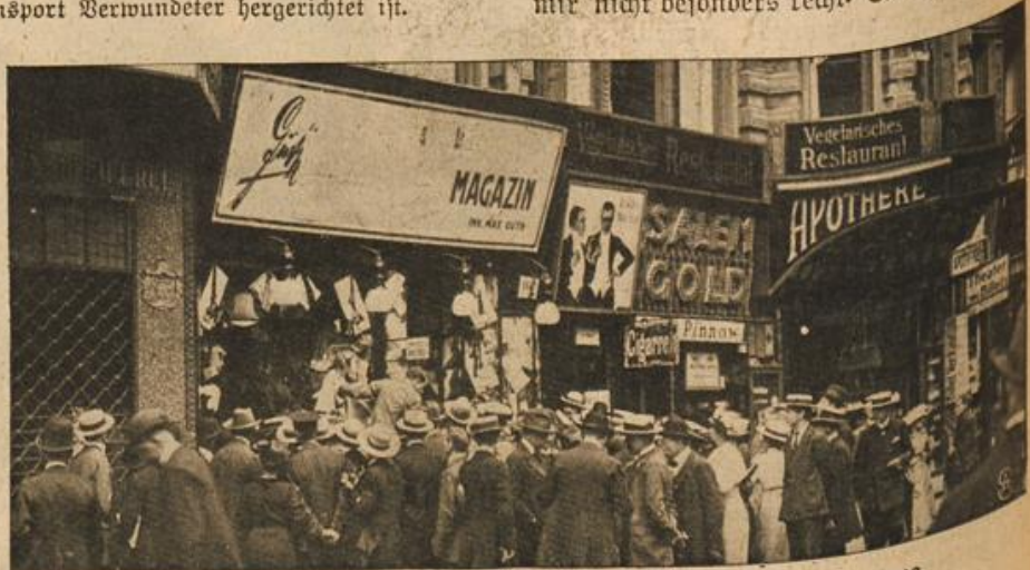
Ueberstrichenes Firmenschild, das fremdländische Bezeichnungen trug.

„Nun ja,“ knurrte der Baron, „ich weiß nicht, die ganze Heimlichkeiterei ist mir nicht besonders recht. Es ist gut, daß