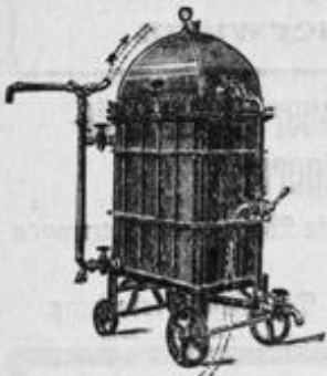
Riese D. R. P.

Filtermaterialien unerreicht an Reinheit u. Filterfähigkeit.