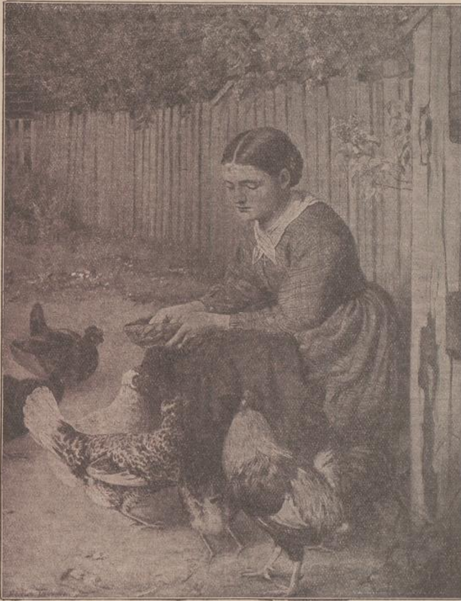
Auf dem Hühnerhofe.

aus unter die bunte Schar, nein, prüfend, lie- bevoll be- trachtet sie jedes ein- zelne, kennt seine Ge- schichte, sie hat es unter ihrer Pflege groß werden sehen, freut sich über das hübsche Fe- derkleid der einen, und das weiße steht bei ihr in besonde- rer Gunst als fleißige Eierlegerin, aber auch der stattliche, wundervolle Hahn da vorn soll nicht zu kurz kommen. Und die viel- farbige Schar ist ganz zahm und vertraut mit ihr; dicht an die Pfle- gerin kom- men die