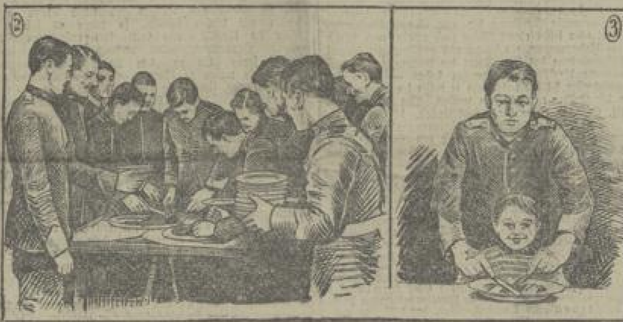
1. Beim Servieren. — 2. Sjens aus der Küche. — 3. Freundliche Wähnung bei einem der kleinen Gäste.