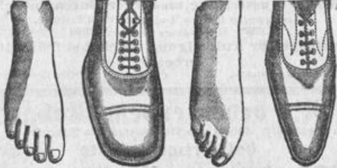
Natürliche Fussbildung, welche beim Tragen von Reform-Façons erhalten bleibt.