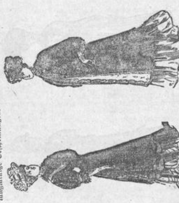
Fig. 1. Fig. 2.

Da ist zunächst das typische Kleid des Winters, ein Samtkleid in einer rötlichen Schattierung. (Figur 1.) Der Rock hat vorn eine tablierartige Garnitur und schlagelapen, in Knöchelhöhe ausringelnden Falten und ringsum einen Besatz aus Seidenstoffe mit einer Densgarnitur. Die Taille legt die hochmoderne Kragengarnitur, die in diesem Falle originalerweise mit einer Doppelreihe von Knöpfen unter dem Hiefen, herzförmigen Ausschnitt geschlossen ist. Dieser Knöpfel reicht beinahe bis auf den sehr hohen, falkigen Gürtel. Ein schmaler Schaltragen fällt den Hiefen Knöpfel ein, unter ihm kommt eine gekrenzt farbige Stickerei zum Vorschein, die den obligaten cremefarbenen Stickereinsatz und Stieftragen begrenzt.