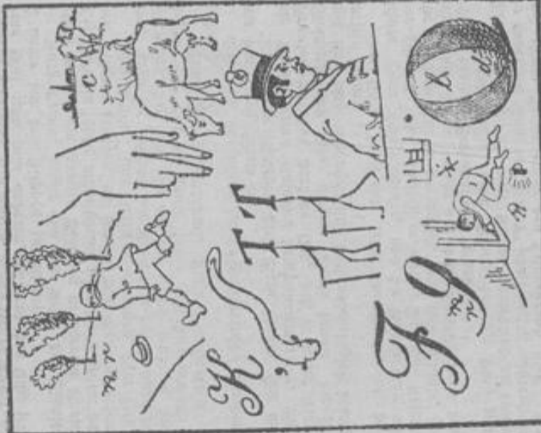
(Lustigkeit folgt in nächster Nummer.)