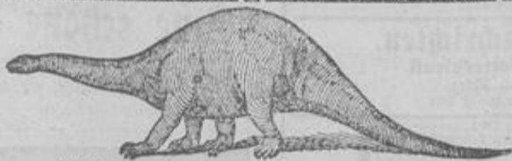
Atlantosaurus immanus (etwa 36 m lang und 20 m hoch). Probestück aus:

und mehr, geehrte Hausfrau, können Sie im Laufe der Zeit für Neuanschaffung und Reparatur sparen, wenn Sie Ihre schöne Wäsche nur mit unschädlichen, guten Wasohmitteln und nicht mit für billiges Geld Ihnen verkauften, scharfen und Chlor enthaltenden Waschpulvern behandeln. Gioth's gemahlene Kernseife mit Salmiak und Terpentin ist garantiert unschädlich für Wäsche und Hände, chlorfrei und kostet per Paket nur 15 Pfg. Alleinige Fabrikant: J. Gioth, Hanau.