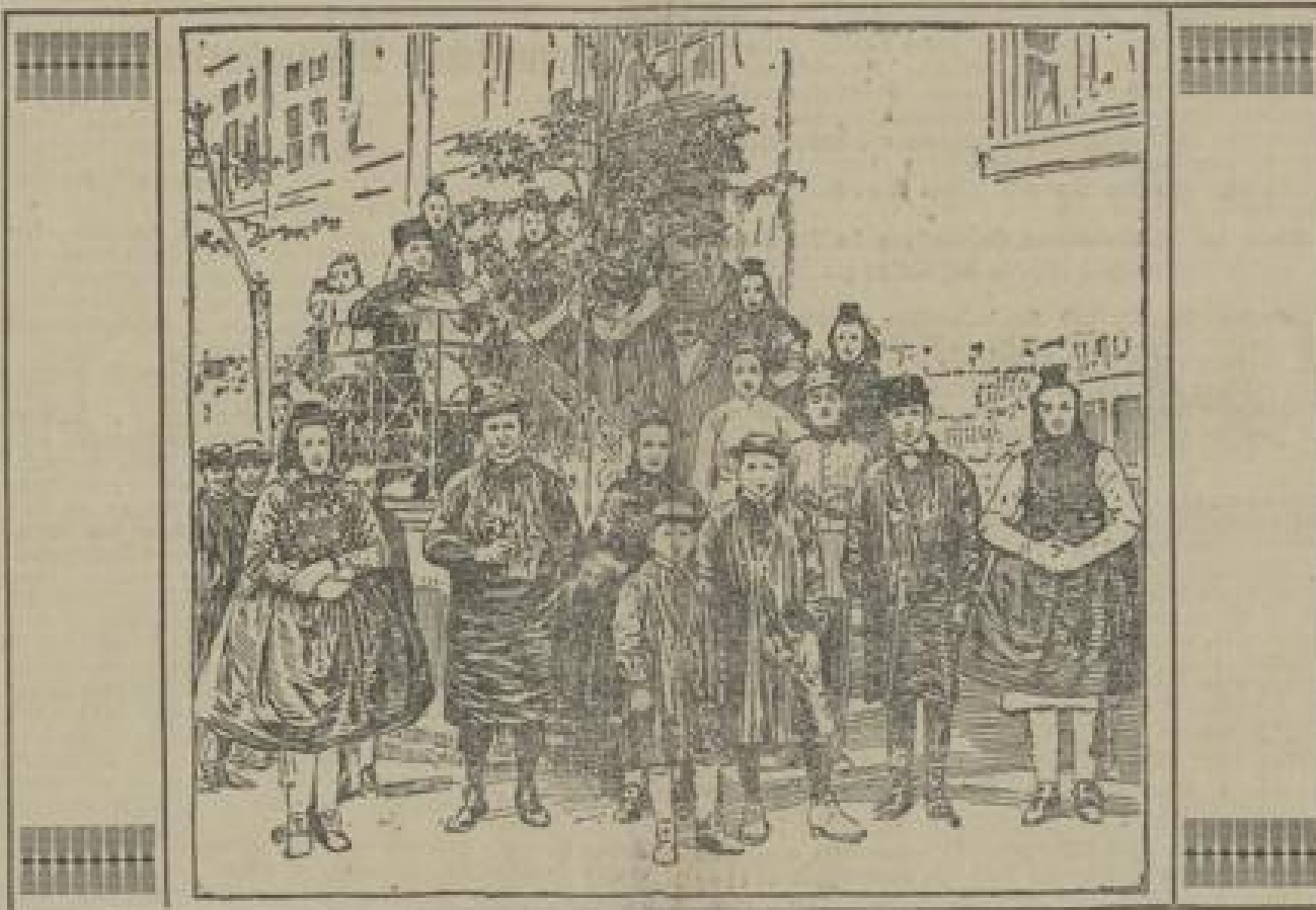
Der letzten Tagen fand, seit längerer Zeit zum ersten Male wieder, in den Dörfern Nordhessens bei Treffs eine große heilige Bauernhochzeit statt, zu der Hunderte Teilnehmer in den malerischen Schindler Volkstrachten erschienen.