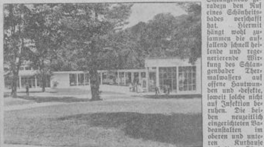
Weinbrunnen mit Wandelhalle.

Schlangenbad liegt an der Grenze des Rheingaus, und zwar geht diese Grenze mitten durch den Ort. Dieser zwar kleine, aber um so herrlichere Gau ist einer der schönsten Teile Deutschlands und hier wächst der deutsche Wein in ganz besonderer Güte. Der echte Weinstemmer gerät schon bei den Namen der Ortshäfen in Begeisterung. Namen wie Nauenthal, der Markobrunn, der Steinberg, das Destricher Venken, der Wintler Hagensprung sind in der ganzen Welt bekannt, aber auch die berühmten Stätten des Rheingaus wie die herrliche Pfalz von Kibitz, das Kloster Eberbach, der berühmte Kran in Destrich, das Brentano-Haus in Winkel, der Johannisberg, der Niederwald mit dem National-Denkmal, der Mületurm, die Krone in Ahmannshausen, Schloß Rheinstein, die Totentanz bei Borch und dessen alte Häuser sind Ausflugsziele, die jeden locken müssen. Nach Wiesbaden, Bad Schwalbach, Nauenthal, führen schöne Waldwege, Tagesausflüge zum Feldberg, nach der Saalburg, Soden usw. Von Schlangenbad sind sämtliche Ortshäfen meist in einer Nachmittagsstunde zu erreichen und somit ist Schlangenbad der bequemste Ausgangspunkt für Ausflüge in den Rheingau, ist aber selbst von der gefährlichsten Rheinflaute verschont.