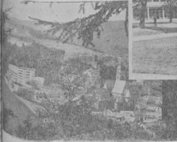
Bad Schwalbach i. T.

Wenn beim Zusammenstellen und Ueberlegen von Reiseplänen so auch volkswirtschaftlich in dem aufbauenden Sinne „Deutscher erkenne deine Heimat!“ gedacht wird, dann leistet jeder einzelne Volksgenosse etwolle Arbeit am Wiederaufbau, die schon in absehbarer Zeit die Früchte tragen wird. Darum: rednet, überlegt und handelt deutsch: bleibt in der Heimat!