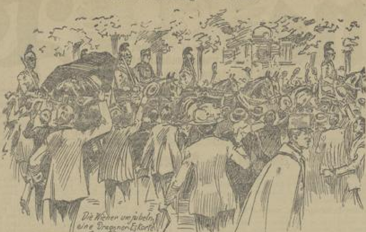
Die Wiener verjahren eine Dragoonerkolonne auf der Ringstrasse