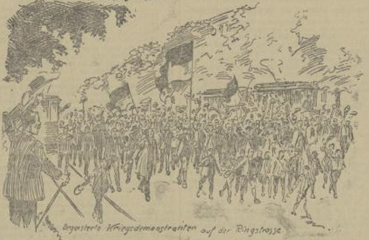
Regimentäre Kriegsdemonstrationen auf der Ringstrasse

Unter dem Namen der ... (Small text block at the top left of the page)