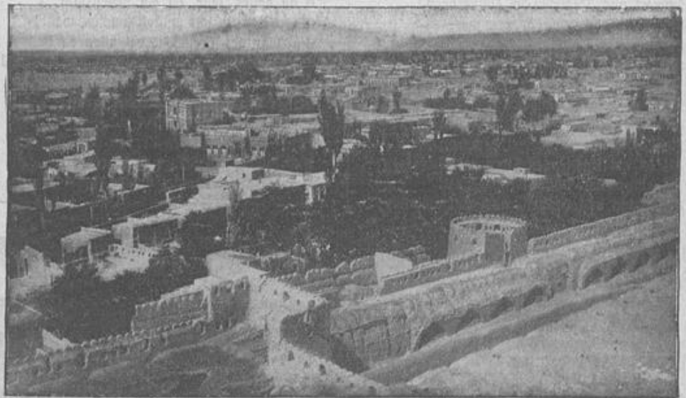
Ansicht von Tabris mit dem armenischen Viertel.

wurde jetzt von den Türken eingenommen und dabei 2000 Russen niedergemetzelt. Die Perser nehmen nun an dem Aufstande und den Kämpfen gegen die Russen teil und gehen, vereint mit den Türken, nach dem Kaukasus. In den Kämpfen in diesem unwegsamen Gebirge haben die Russen schon empfindliche Niederlagen erlitten.