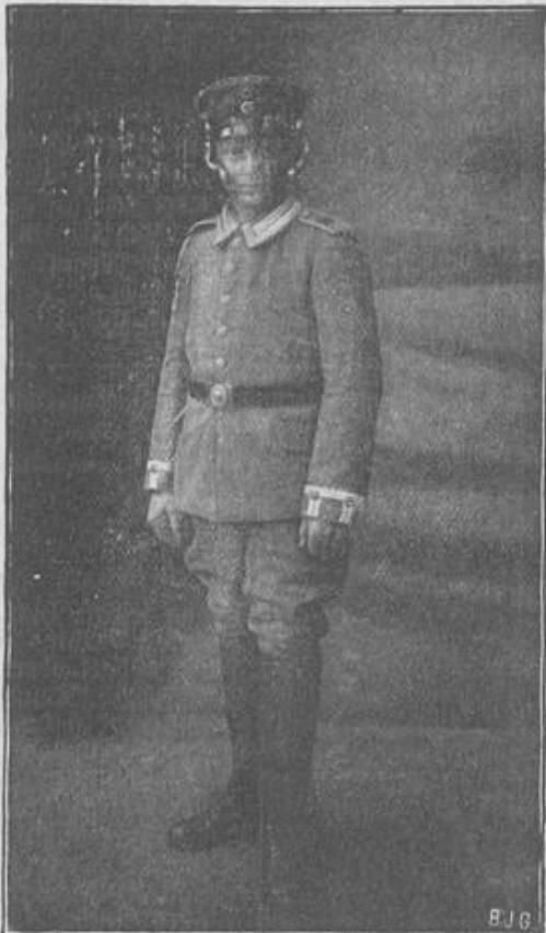
Ein 15-jähriger Unteroffizier.