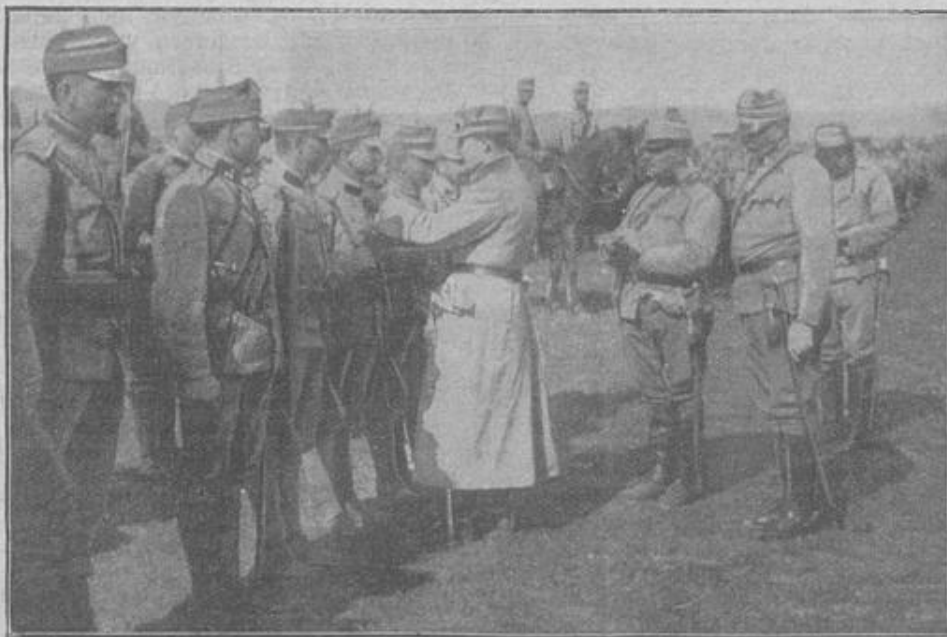
Der österreichische Thronfolger, Erzherzog Karl Franz Josef, deforiert auf dem galizischen Schlachtfelde die tapfere Mannschaft eines Kavallerie-Regiments.

forgenden Blicken aufgeschaut, wenn ihre Tochter Flora ihr die Postschachen ins Zimmer brachte.