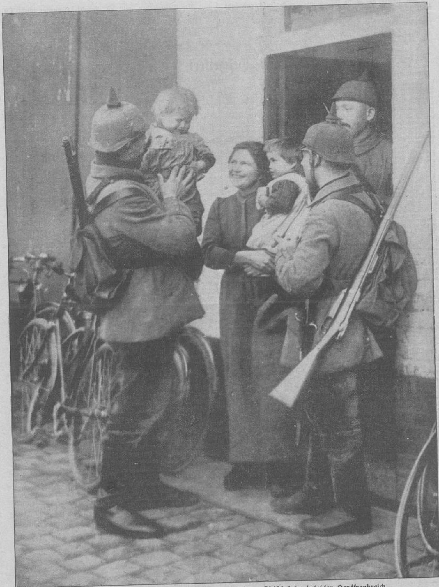
Gutes Einvernehmen mit den Quartierwirten: Herzlicher Abschied im besetzten Nordfrankreich.