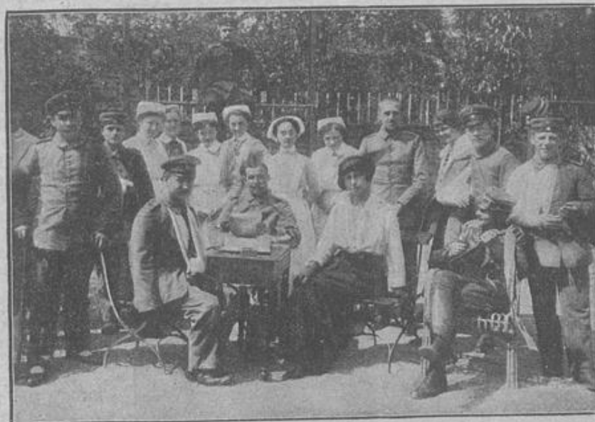
Die Schwester unseres Kaisers bei den Verwundeten.

hatten, nicht umsonst geflossen war. Sie waren im Kampf um des Vaterlandes Größe und Herrlichkeit gefallen. Schlimmer waren die daran, die keine bestimmte Nachricht über das Schicksal ihrer nicht heimkehrenden Lieben erhalten hatten, denen man den Verbleib ihrer Angehörigen mit dem kurzen Bemerkten „Vermisst“ angezeigt hatte, das die verschiedensten Möglichkeiten in sich schloß. Die Hoffnung, daß der Vermisste noch am Leben war, vielleicht durch schwere Krankheit oder andere widrige Umstände verhindert, Nachricht zu geben, und daß er eines Tages plötzlich wieder auftauchen würde, war nicht ganz ausgeschlossen, aber noch wahrscheinlicher war die Vermutung, daß er, anstatt den rühmlichen Tod in freier Feld-