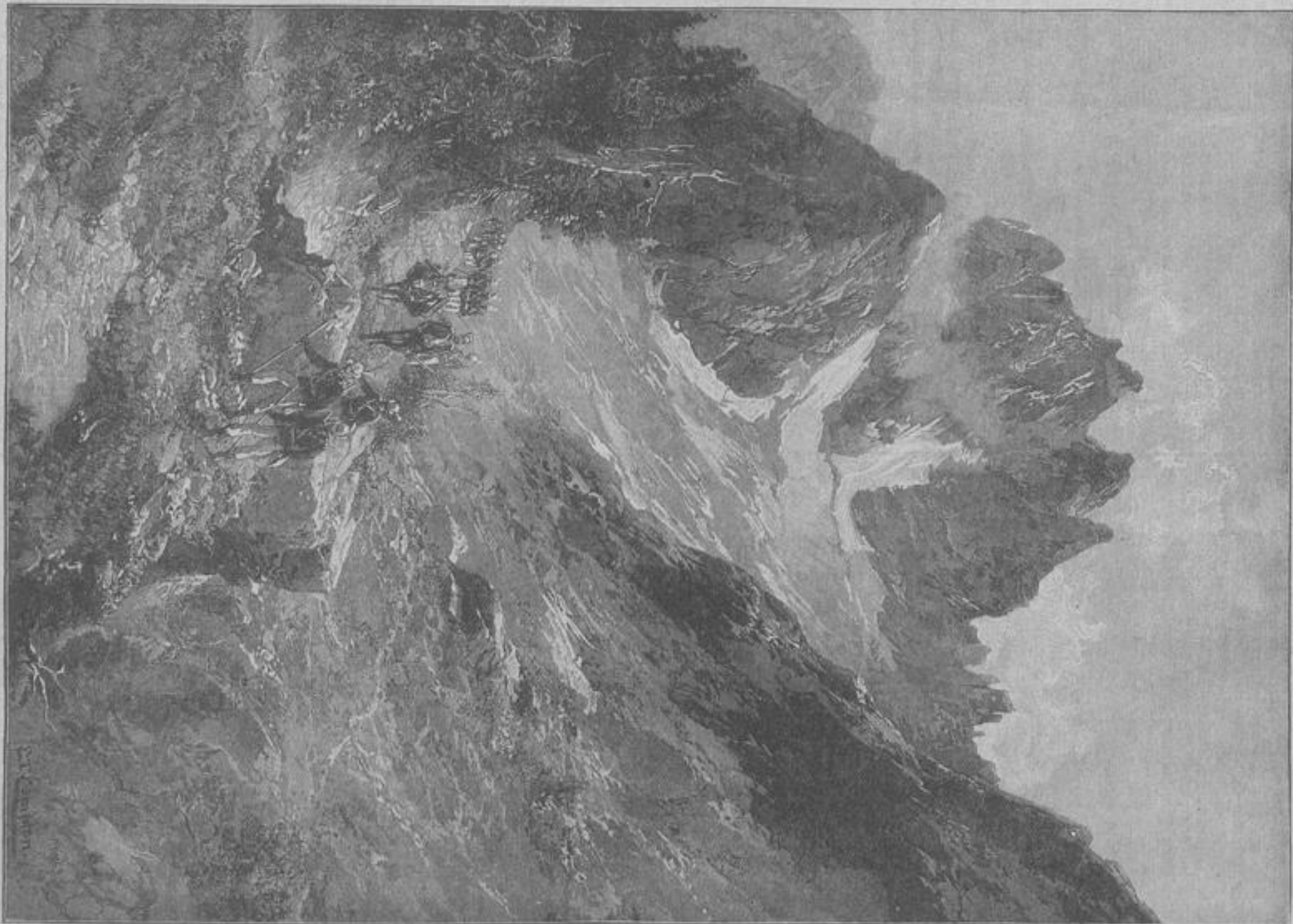
Eine italienische Patrouille der Alpen in den italienischen Grenzgebirgen. von C. L. Compton.

einem Tische ein Wort der Achtung für den Bergmannen. Und dann schneigen wir weiter. Und setzen uns in unsere Heimatblätter. Und fuchen, fuchen, fuchen, fuchen, nach Siegern, nach unseren Siegen, über die Mütter der Mächtern, am Tische nebenan . . . .